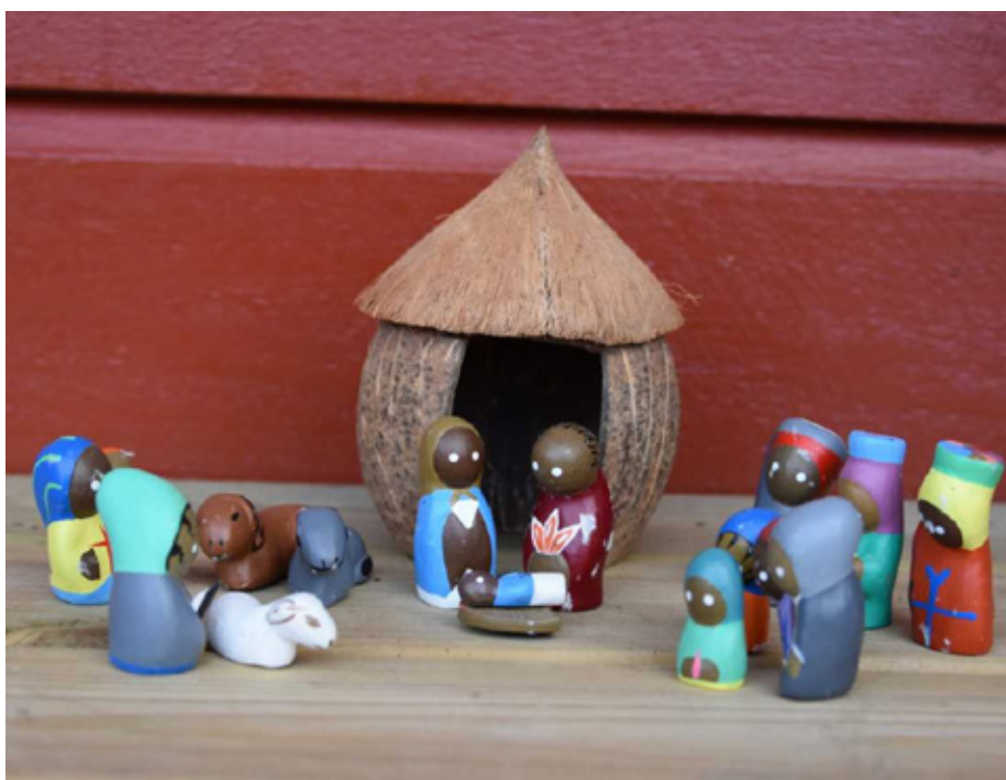
Julekrybbe fra Haiti