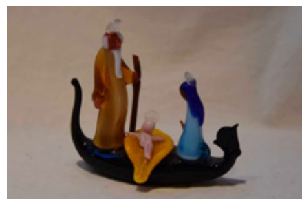
En glasskunstner i Venezia ser for seg den hellige familie i gondol