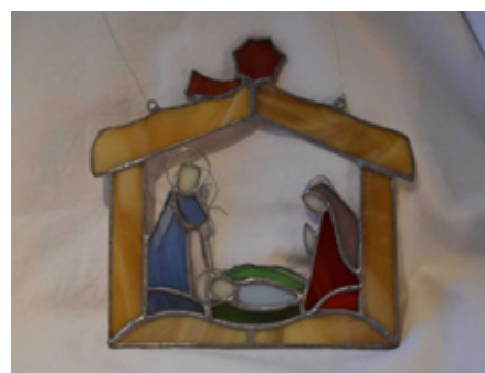
En glasskrybbe innkjøpt på historisk marked på Olavsfestdagene