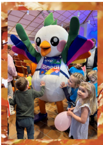
Snedi med barna.

Nå er det tid for å planlegge VM-festen i Kolstad kirke.