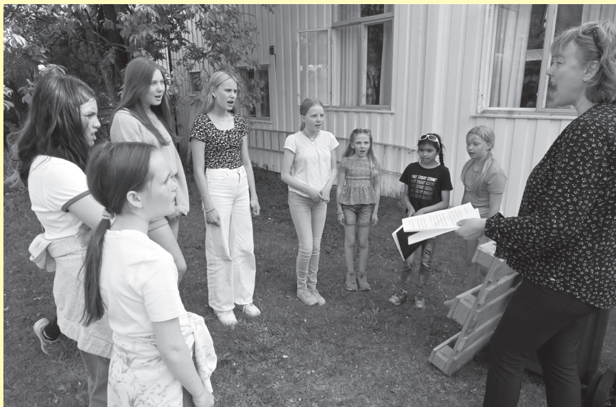
Konsentrerte Regnbuesangere øver før opptreden på frivillighetsfesten 12. juni.

Se mer info på facebooksidene til Trysil kirke.