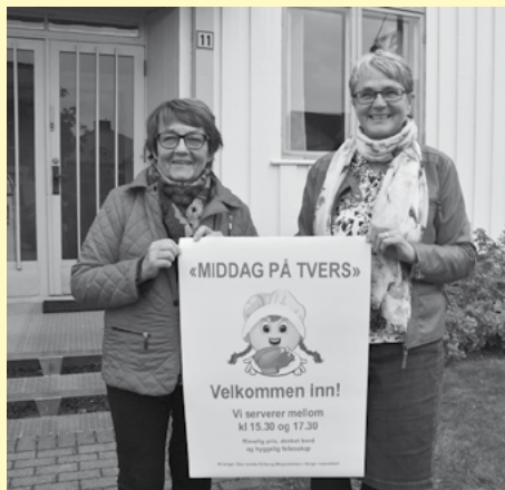
(Bildet er tatt i anledning 5 års jubileet for Middag på tvers)

Middag på tvers samler mennesker i alle aldre og alle nasjonaliteter til en rimelig middag på Misjonshuset i Trysil hver måned. Det møter mellom 70-120 mennesker fra alle samfunnslag hver gang. Av og til er det underholdning. Det er en flott arena for knytting av bånd,