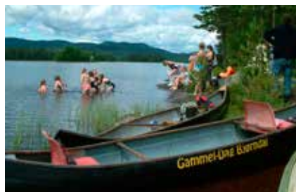
STRANDHUGG: Under en av utfluktene, var det ved lunsjtider på sin plass å gå i land for å bade og spise ( i rett rekkefølge...)