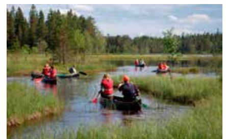
PÅ DAGSTUR: Her er deltakerne samlet på demningen i sørenden av Storøyungen, der elva Gjermåa har sitt utspring.