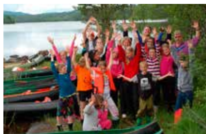
EKTE NATUROPPLEVELSER: Her er leirdeltakerne en tur i land for å strekke bena under en kanoutflukt sørover i Storøyungen.