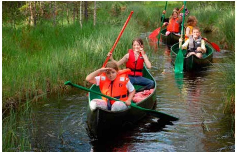
UKJENT FARVANN: Jenter og gutter opplevde mange spennende aktiviteter under Ullensaker menighets sommerleir i Romeriksåsene. Her utforskes "Professor Drøvels kanal"