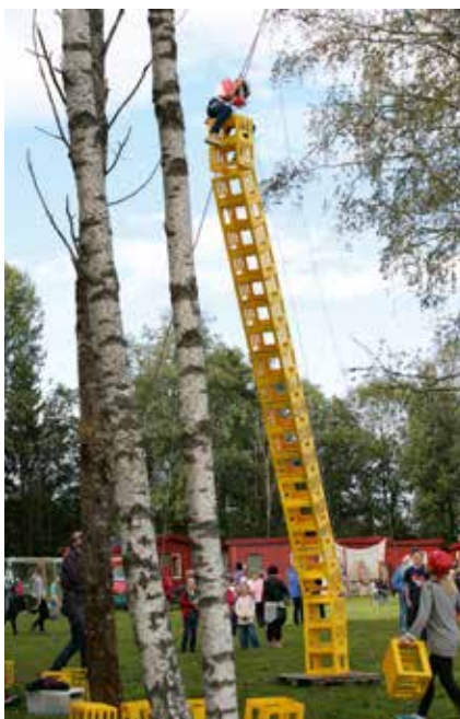
Aktivitetsdag på Folkvang.

Festival F 2014 går av stabelen 19. – 21. september. Hold av denne helgen allerede nå!!