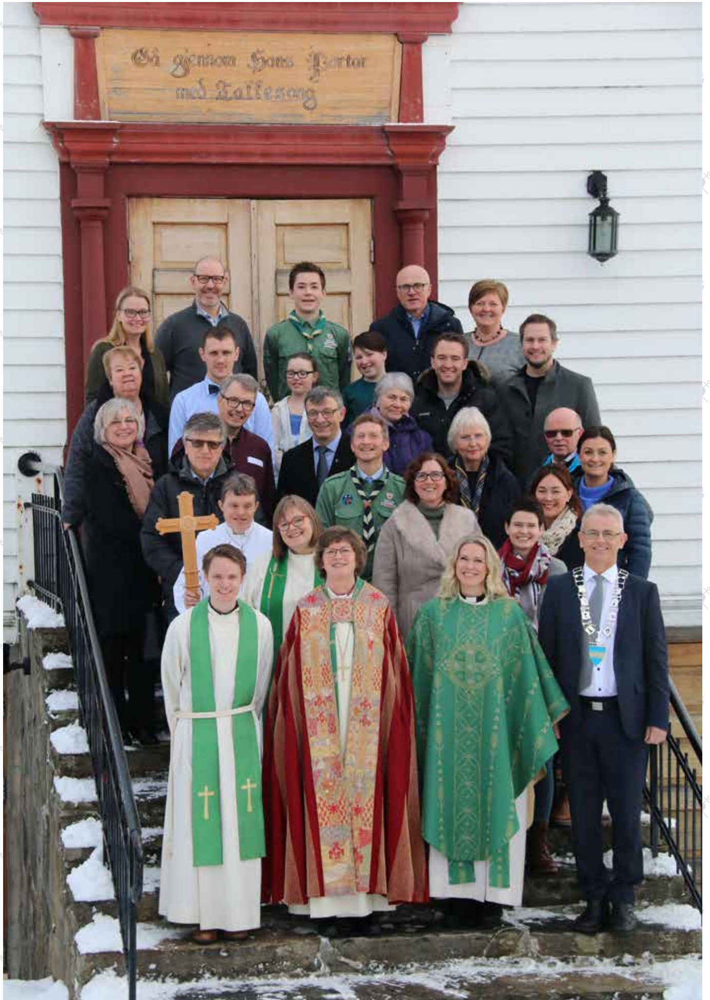
Bispevisitas vinter 2019: Kyrkja er ein viktig samfunnsaktør og dei tilsette kan bygge arbeidet sitt på gode relasjonar til politikarar, kommuneadministrasjon og frivillige lag og organisasjonar.