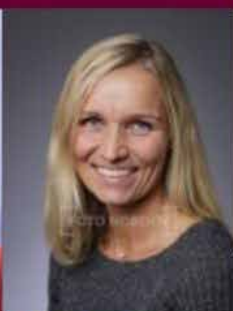
Karete Malen Nettet