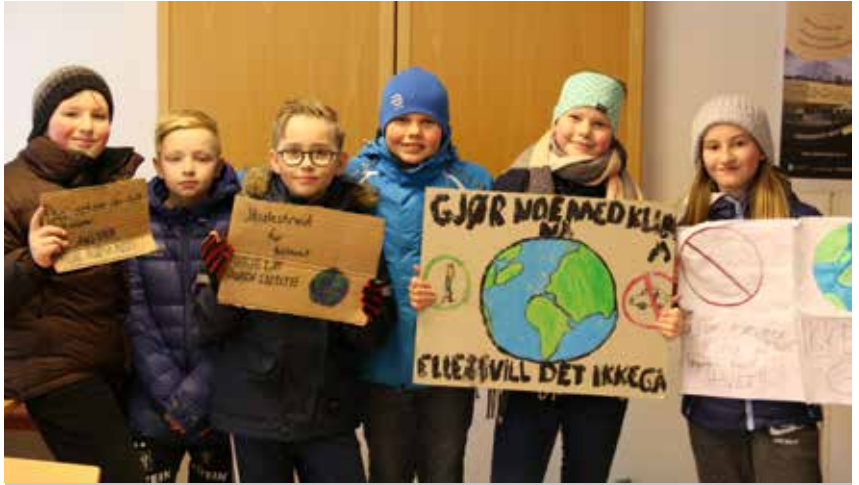
Denne sida, øverst: Fridays for Future på besøk på kyrkjekontoret. Det å ta vare på skaparverket er eit ansvar som også kyrkja er oppteken av.

Kyrkjelyden har som målsetting å fremme glede og respekt for skaparverket og arbeider med den bibelske forståing av Guds skaparverk og mennesket som ein del av det. Ulstein kyrkjelyd er en grøn kyrkjelyd og det forpliktar. I trusopplæringa er det samlingar for barna i 1. og 2. klasse som fokuserer på dette med skaparverket. Kyrkjelyden har også hatt fleire turar etter gudstenestane organisert av frivillige. Det har og vore friluftsgudstenester.