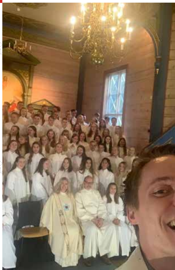
Øverst: Eit dåpsbarn blir løfta fram og blir ein del av kyrkjelyden. t.v.: Biskop Ingeborg Middtømme møter barna på dåpsskulen. f.h.: Det er omlag 100 konfirmantar i Ulstein kvart år.