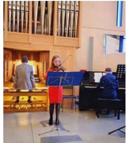
Unge gjestesolister fra Steinkjer under høytidsgudstjenesten i Våler kirke på juledag.