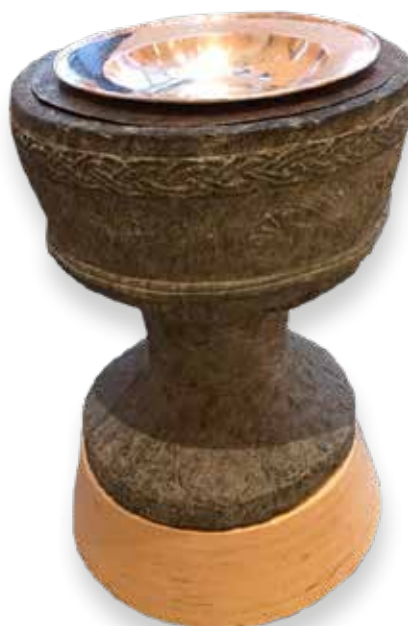
Døpefonten i Våler kirke. Her har vålersokninger blitt døpt gjennom snart 1000 år.