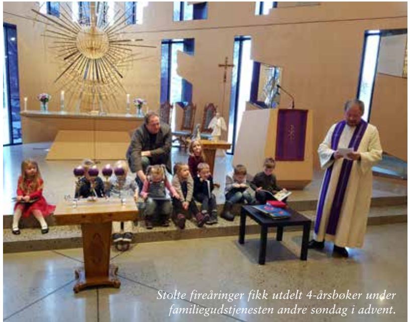
Stolte fireåringer fikk utdelt 4-årsbøker under familiegudstjenesten andre søndag i advent.