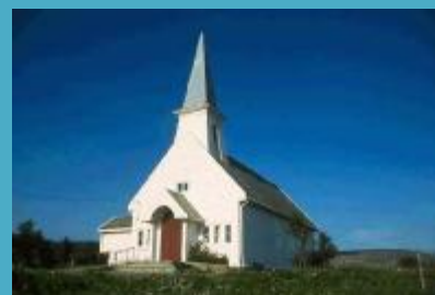
Vestre Jakobselv kirke