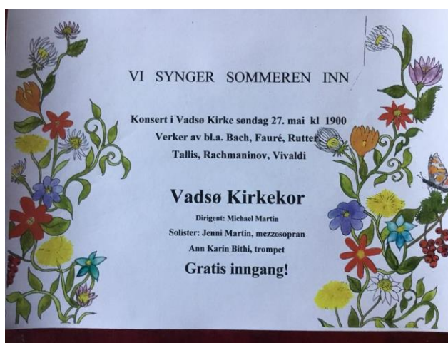
Programmet til «Vi synger sommeren inn»