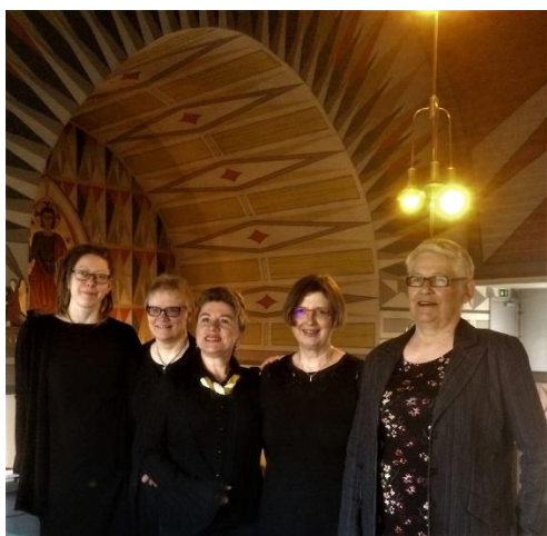
Fem av medlemmene i kirkekolet

Seks konserter var organisert av andre aktører med 1100 besøkende.