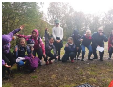
Bilder fra konfirmantleir i Levajok