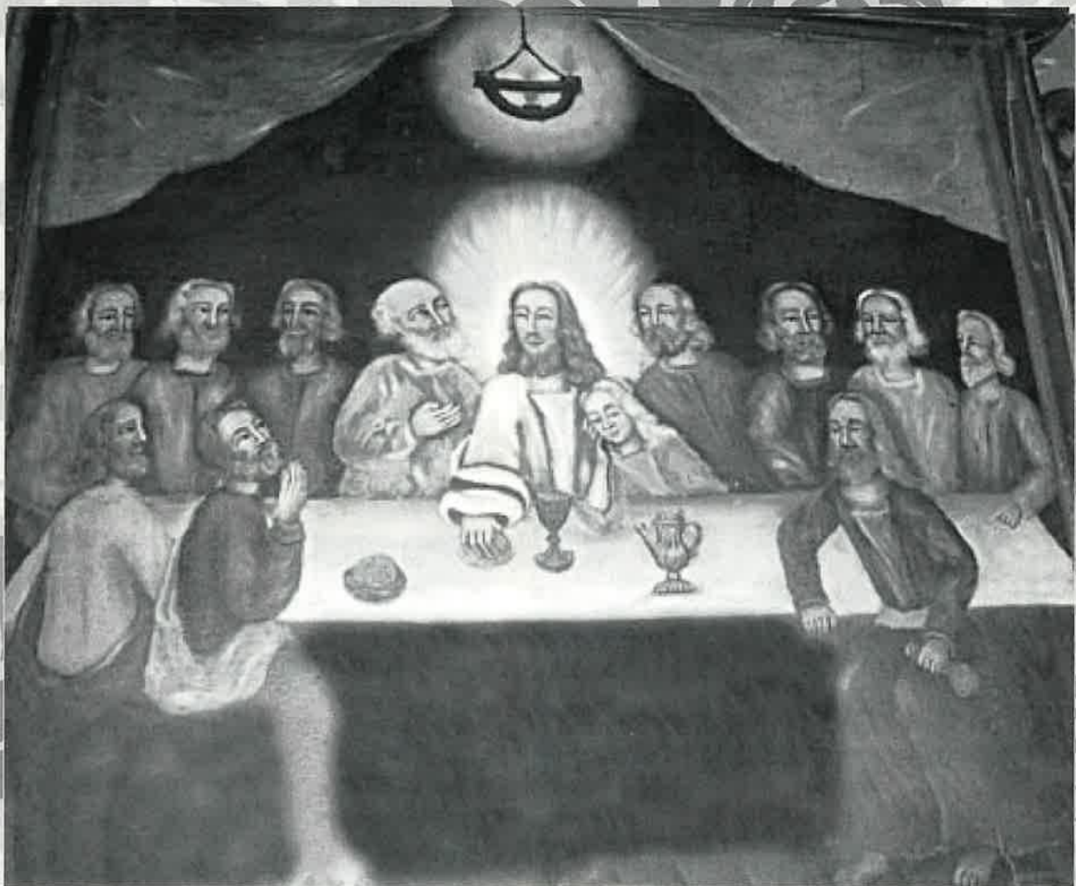
Utsnitt av altertavla i den gamle Stamnes kyrkje.