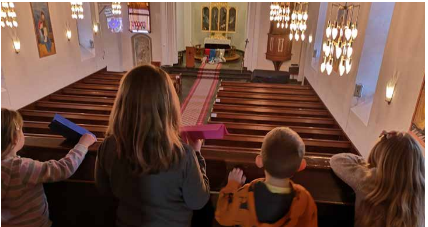
Borna sin påskedag: Etter gudstenesta på Vaksdal kasta me papirfly frå galleriet.