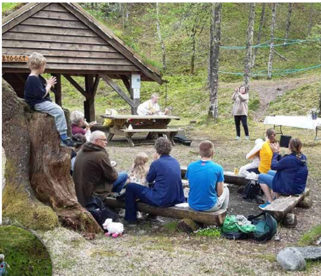
Skipshelleren: Frå gudstenesta i Skipshelleren.