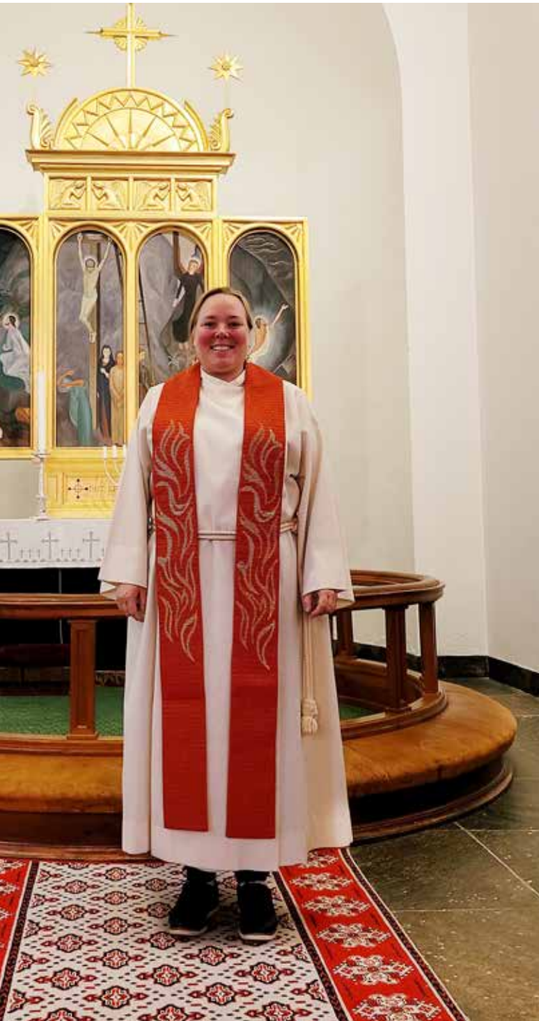
te i pinsa.