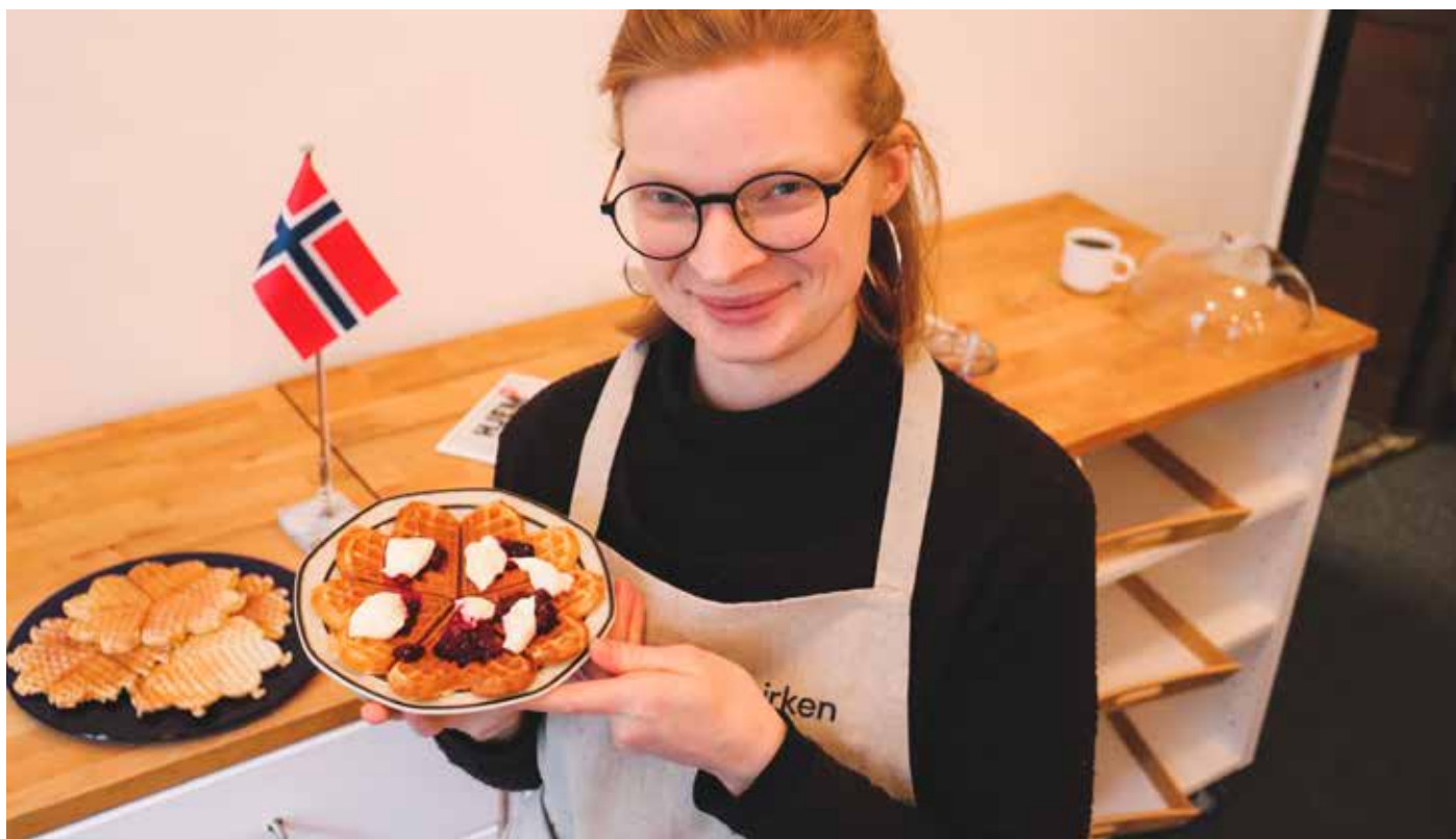
Vaflar: Vafler må til i ei Sjømannskyrkje!