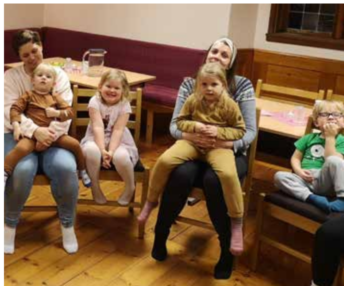
Knøttesong på Dale: Mange som kosar seg på knøttesong.

I vår har me òg hatt knøttesong for born 1-5 år på Dale og Vaksdal onsdagar. Det varierer kor mange som kjem, frå tre til trettien, og det er alltid liv og leik og god song uansett