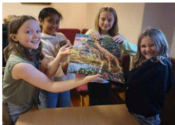
Etter skuletid på Vaksdal: Stolte jenter pusla i rekordfart.

Etter skuletid er for born i 5.-7. klasse, der dei får tilbod om ein stad å vera etter skule onsdagar, vekselvis på Dale og Vaksdal. Borna har fått pølser og saft, og kunna spelt spel eller gjort ulike ak-