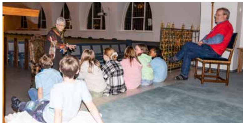
Lys Vaken Dale 2023: Historieforteljing.

Siste helga i januar inntok fleire av årets elleveåringar Dale kyrkje, og overnatta der. Dei var nok spente då dei kom til kyrkja, for fyrste gong med sovepose! Men opplegget fen-