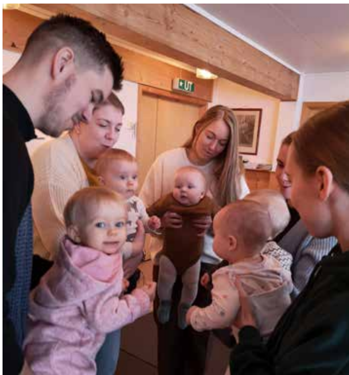
Babysong på Dale: Mange på babysong på Dale.

I vår er det som i haust baby- og småbornssong vekselvis på Dale og Vaksdal på onsdagar. Det har vore ein fin gjeng med små og store som har sunge og leika saman, og pra-