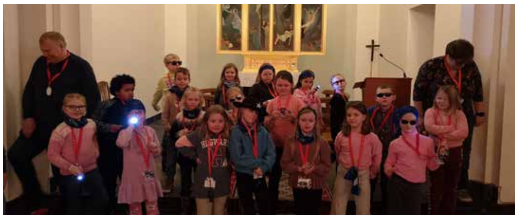
Spanande: Tårnagentar på Vaksdal.