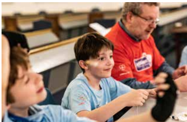
Lys Vaken Dale 2023: Aktivitetar for borna.