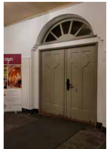
Oppussing på dugnad: Våpenhuset mot hoveddøra, før oppussinga (t.v.) og etter (t.h.).