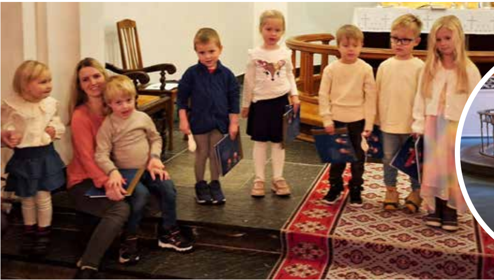
Fireårsbok: Fireåringar på Vaksdal.