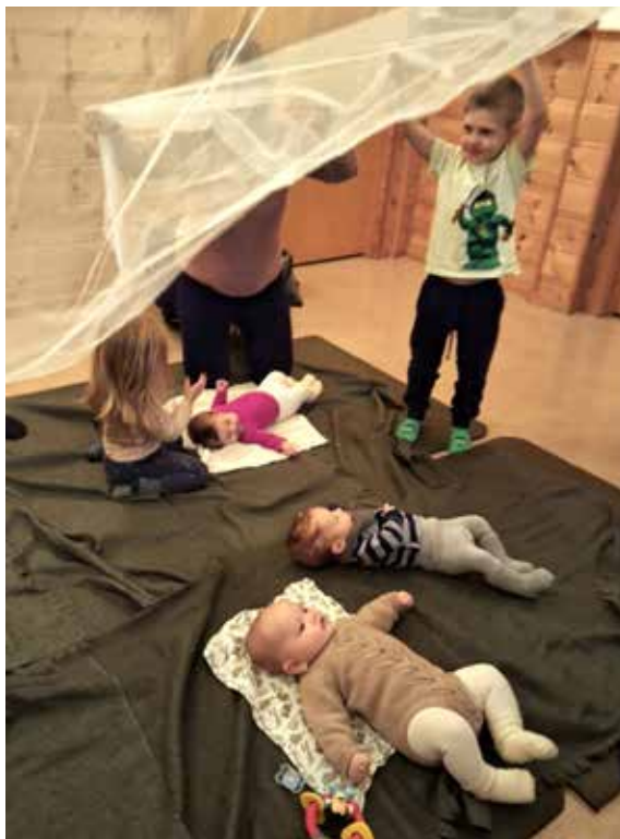
Dale: Baby- og småbornssong med sysken som hjalp til på Dale.