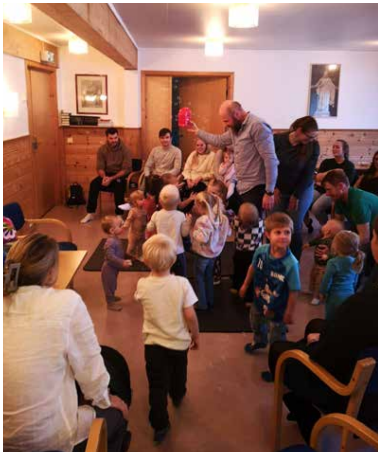
Knøttesong: På Dale har det innimellom vore fullt hus og stormande jubel.