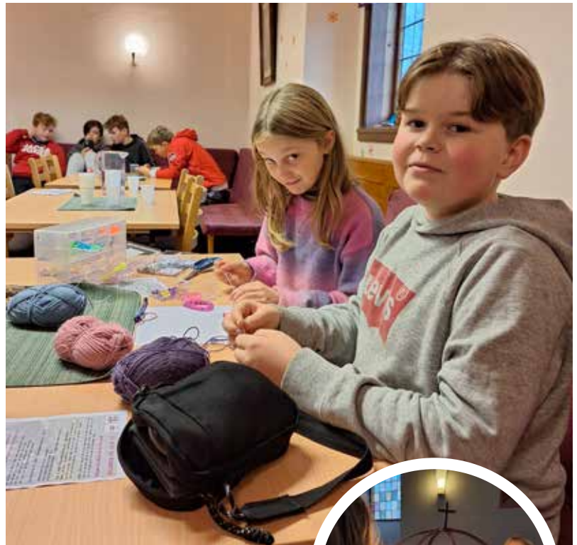
Etter skuletid: Etter ei matstund er det hobbyaktivitetar for dei som vil.