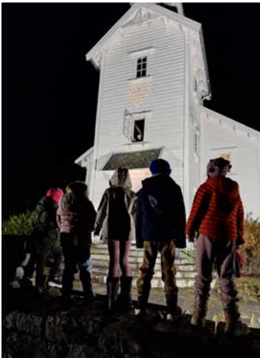
Hjarte: Stamnes barnekor såg på då hjartet blei tent på kyrkja.