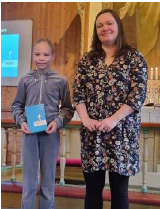
Nyetestamentet: Tiåring på Stamnes.