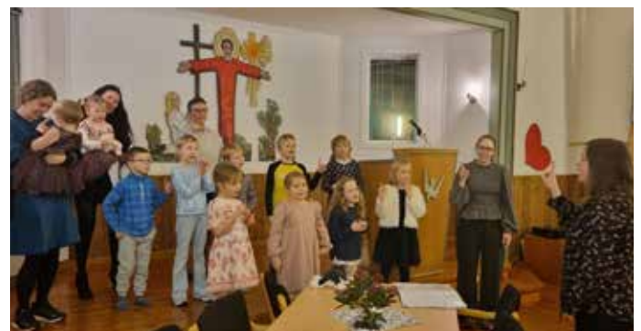
Bedehusbasar: Stamnes barnekor song.

ikkje gjort, men styret for bedehuset er svært nøgde med og takksame for resultatet. Dette er ein kveld som mange ser fram til, og både stemningen og resultatet syner at bygda set pris på bedehuset sitt! Huset treng ein del naudsynt vedlikehald, og alt kostar pengar. Med anna skal taket isolerast i næraste framtid. Ein hadde mange ivrige unge medhjelparar til å dela ut gevinstar, såg ut som nett