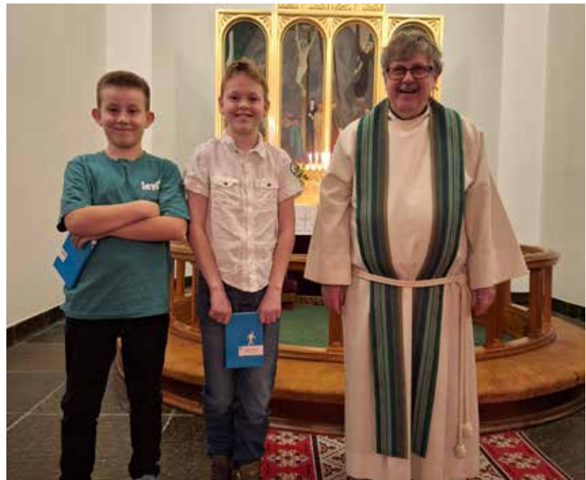
Nyetestamentet: Tiåringar med NT på Vaksdal.