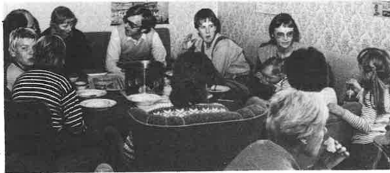
Første oktober var det ungdomsleiarsamling i "Moses-huset".