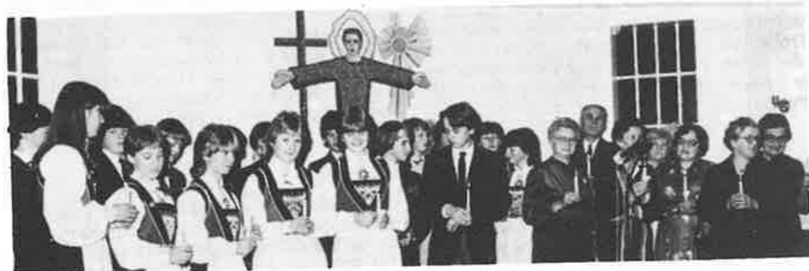
Årskonfirmantane og jubilantane er lysberarar.

På Stamnes er det tradisjon å samla årskonfirmantane og 50-års konfirmantane til fest, saman med konfirmantforeldre og bygdefolk elles. Her ser me frå festen 15. oktober.