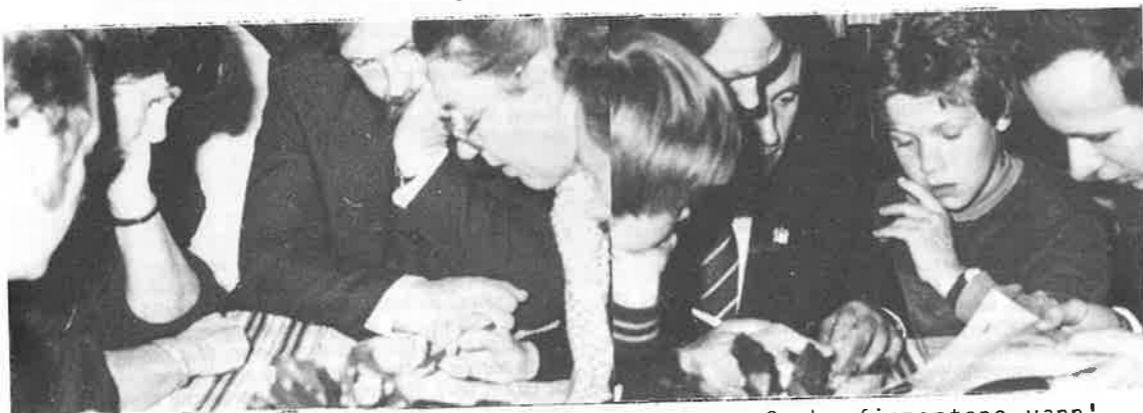
Alle var ivrig med på bordkonkurransen, men årskonfirmantane vann!