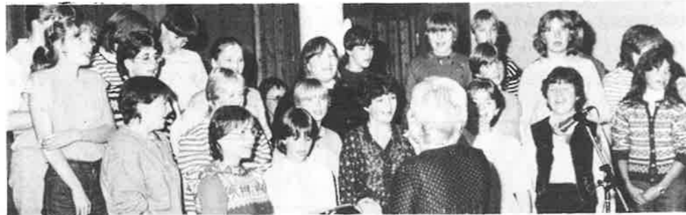
På kyrkjelydsfesten i kantina på Dalefabrikker 2.oktober song Ten Sing .