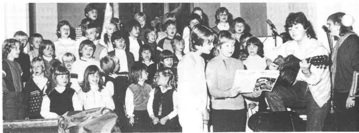
Vaksdal barnekor gledde alle med den fine og friske songen sin.