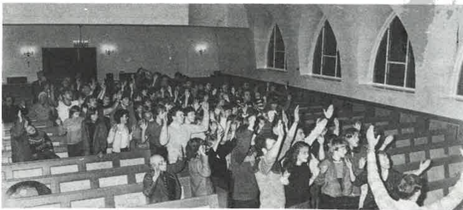
Frå Gospelkvelden i Dale kyrkja.