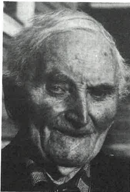
Me ynskjer lukka og signing over livskvelden.