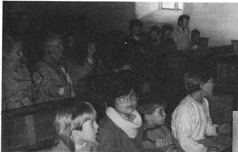
Frå gudstenesta i Bergsdalen