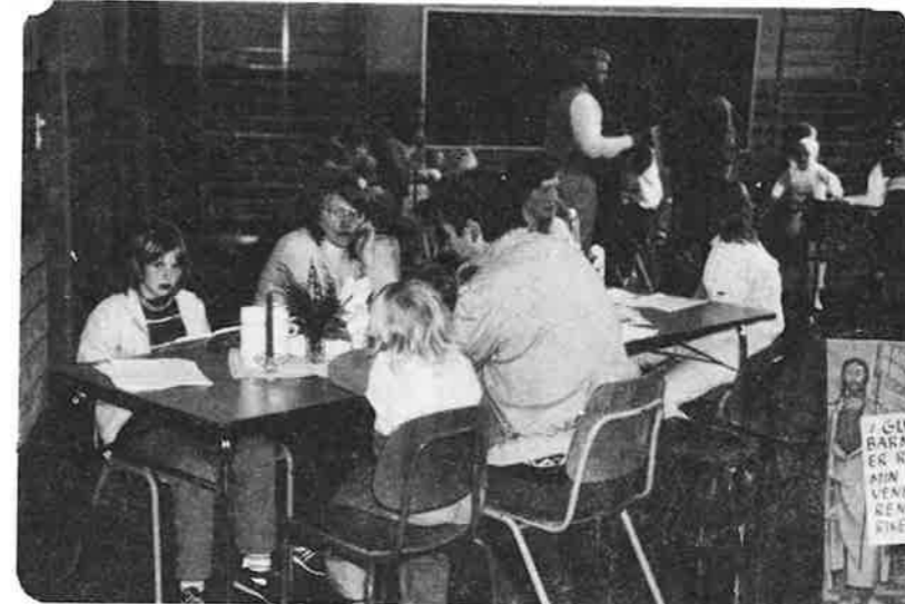
Frå Bergo skule