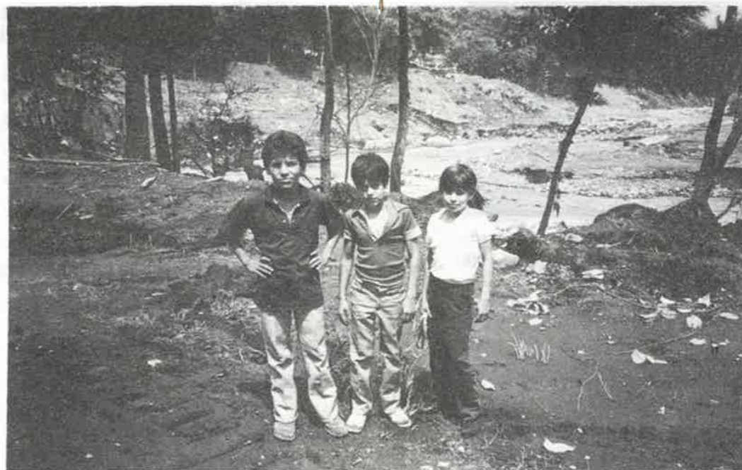
Vi må ikkje gløyma dei som overlevde vulkanutbrotet i Colombia. Dei treng framleis hjelp, mellom anna til attreisning av bustader.

— Hugs at dei som overlevde har vore gjennom ei forferdeleg tid. Mange har mist dei nærmaste, saman med alt dei åtte. Derfor