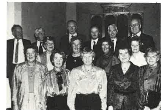
50-ÅRSKONFIRMANTANE I VAKSDAL