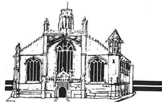
ST. MICHAEL LE BELFREY - YORK