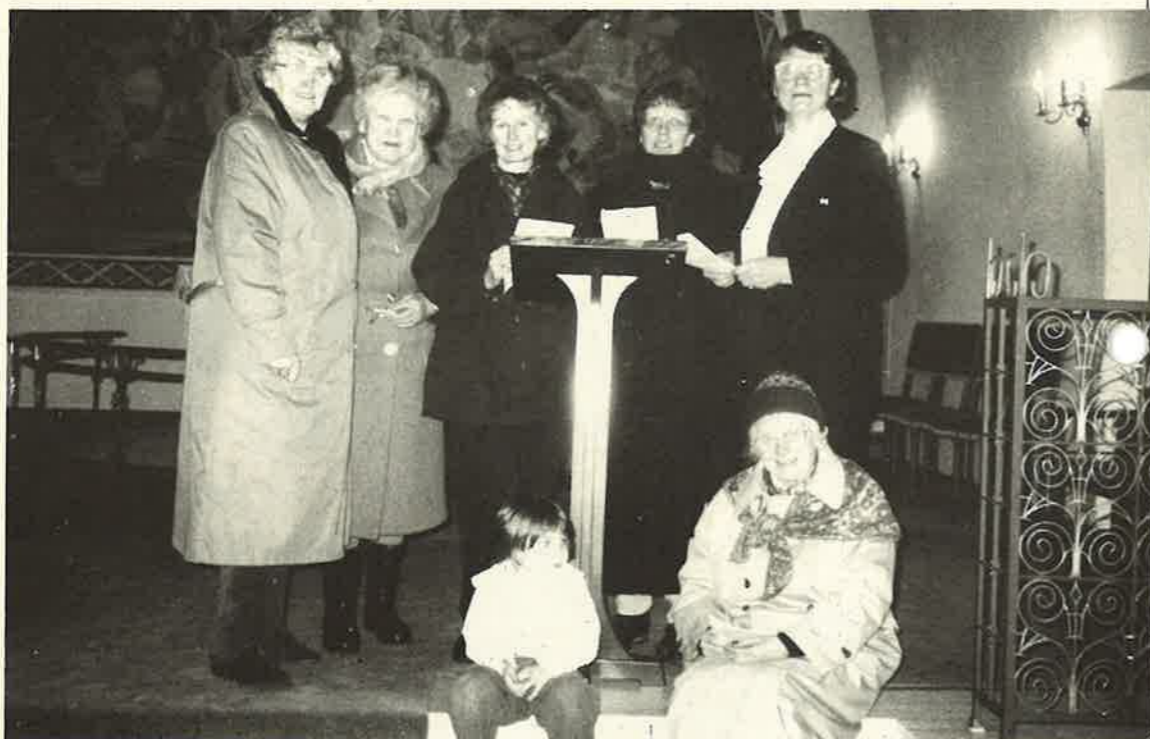
Nokre av dei som var med på Kvinnenes Verds Bønedag i Dale Kyrkje