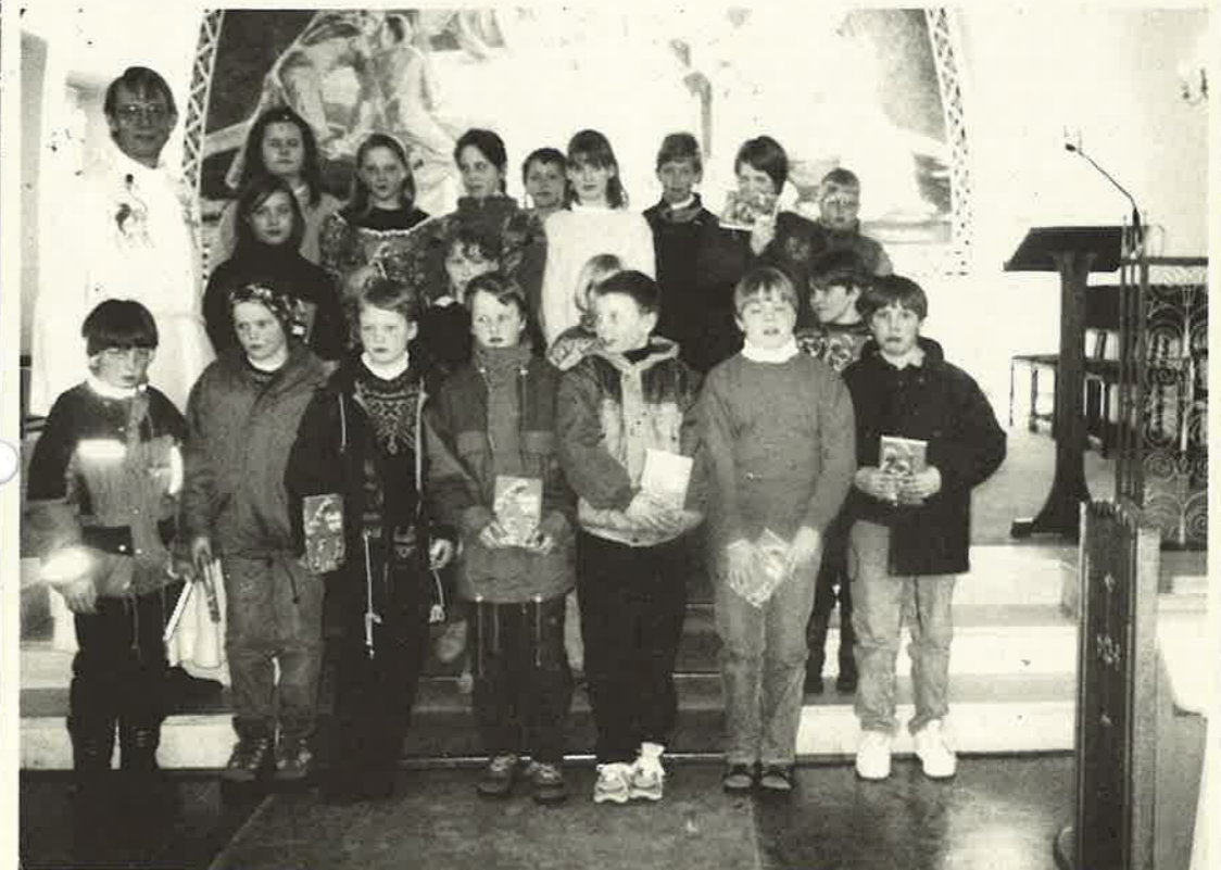
Utdeling av Godt Nytt til 4.klassingar frå Dale og Stanghelle i Dale Kyrkje 20. mars.