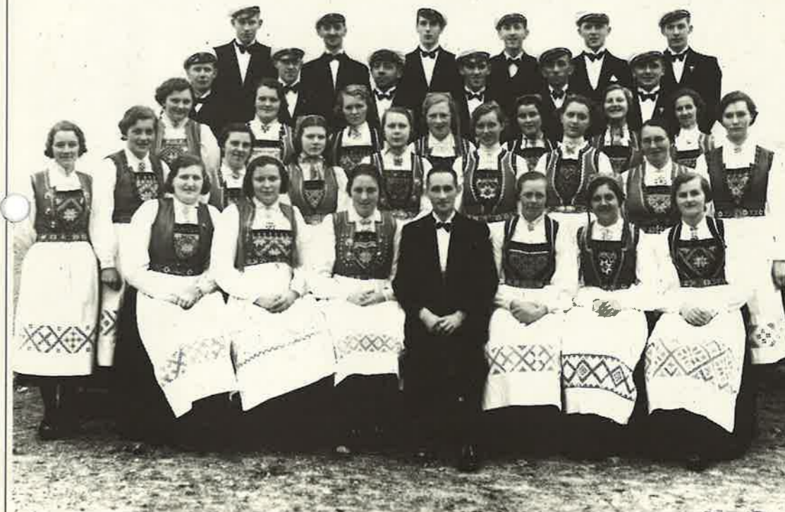
Dale Indremisjons kor. Biletet er frå 30-åra.