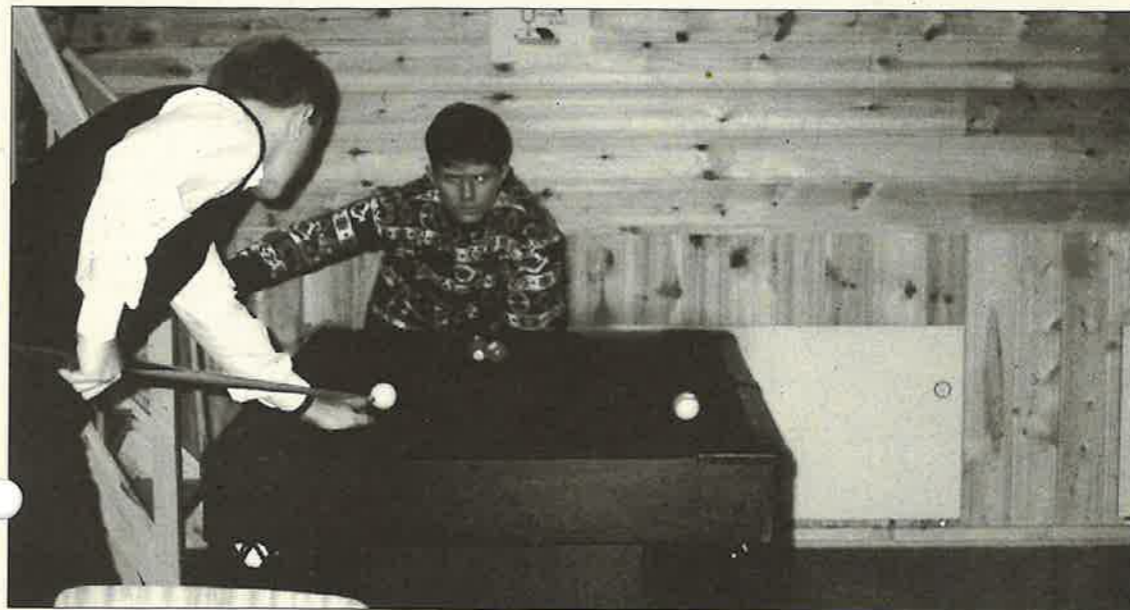
Spel og musikk er nokre av tilboda på nattkafeane.