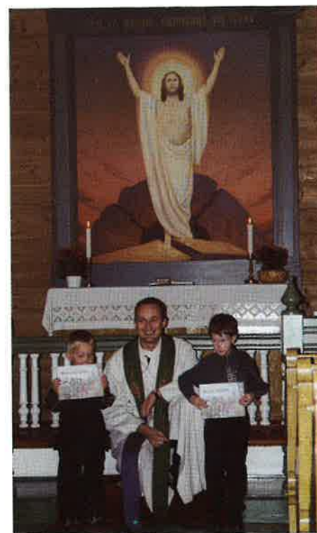
Fireåringar i N e s h e i m kyrkje 8. okt.