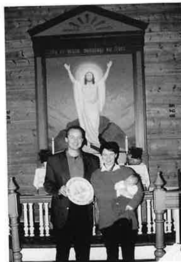
Frå sokneråd i Eksingdalen og Nesheim fekk dei eit fint trefat.