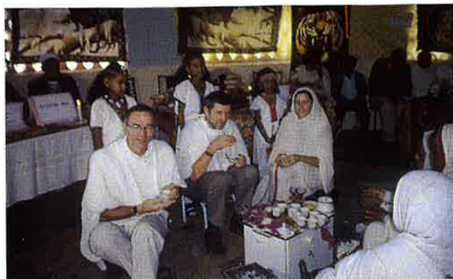
Vaksdal-delegatane i kaffiseremoni ved velkomstfesten.