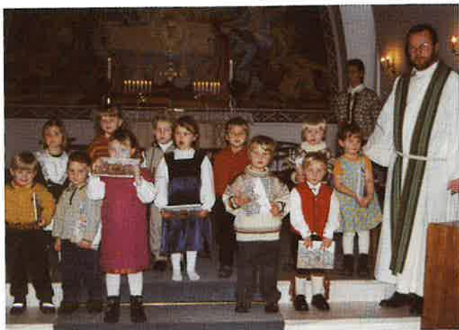
Fireåringar frå Dale i Dale kyrkje 19. nov.