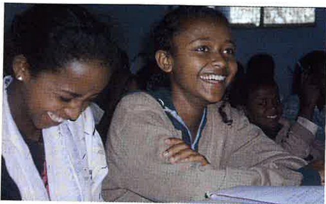
Glade ungdomar i overfylt klasserom.

Det vart elles utveksla mange elev-adresser frå skuleborn i Vaksdal, så i tida framover vil nok ein god del pennevenner finna kvarandre!