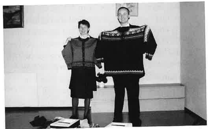
Varme kleplagg vanka det frå Vaksdal og Dale sokneråd.