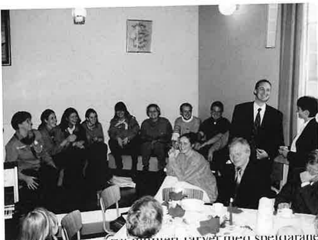
Eit muntert farver med speidarane