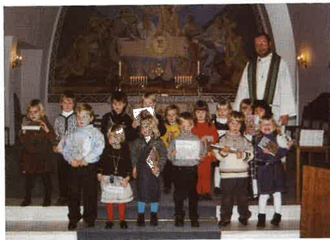
Fireåringar frå Stanghelle i Dale kyrkje 19. nov.