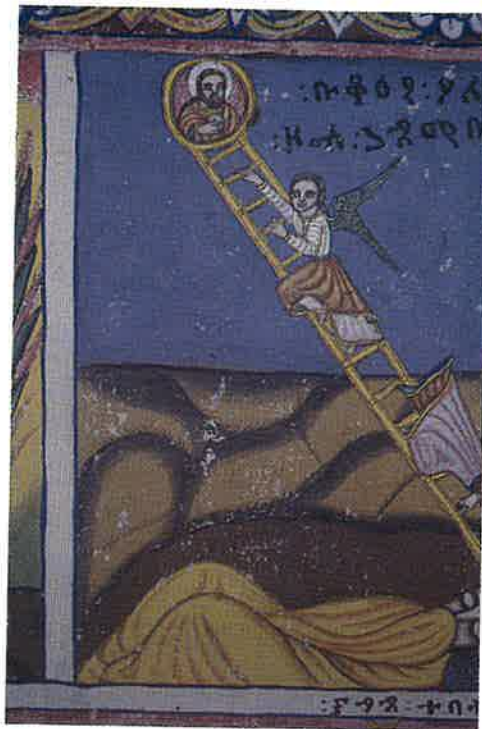
Jakobsstigen, veggmåleri i den koptiske kyrkja.

problemfri omgang med muslimane. Me vitja eit par kyrkjer. Særleg gjorde møtet med ein 96 år gammal prest inntrykk, der han viste oss den rikt dekorerte og mange hundre år gamle kyrkja si. Her fekk me sjå det meste av bibelsoga gjengitt i fargerike og dramatiske veggmaleri. Her var det lange, kristne tradisjonar. Frå Bibelen veit me at ei av dei eldste, kristne kyrkjene vart oppretta i dette området.