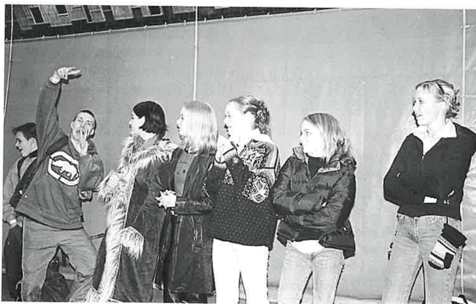
Dei fleste av våre jenter ville heller sjå på (gutane?)

Det eine gutelaget, Vaksdal 2, kom til kvartfinalen, der dei tapte straffekonkurransen. Det andre laget, Vaksdal 1, spela og godt, men kom ikkje til sluttspillet trass to singlar.