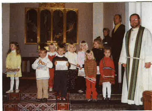
Fireåringar i Vaksdal kyrkje 12. nov.