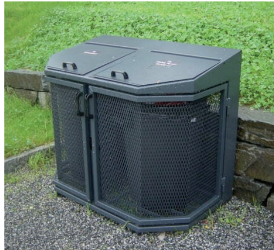
Stanghelle gravplass har fått to slike stasjonar for kjeldesortering.

Løysinga er enkel og rimeleg, og dei som vitjar gravplassen er nøgde. Sorteringa på Stanghelle har gått veldig bra, og me takkar for hjelpa.