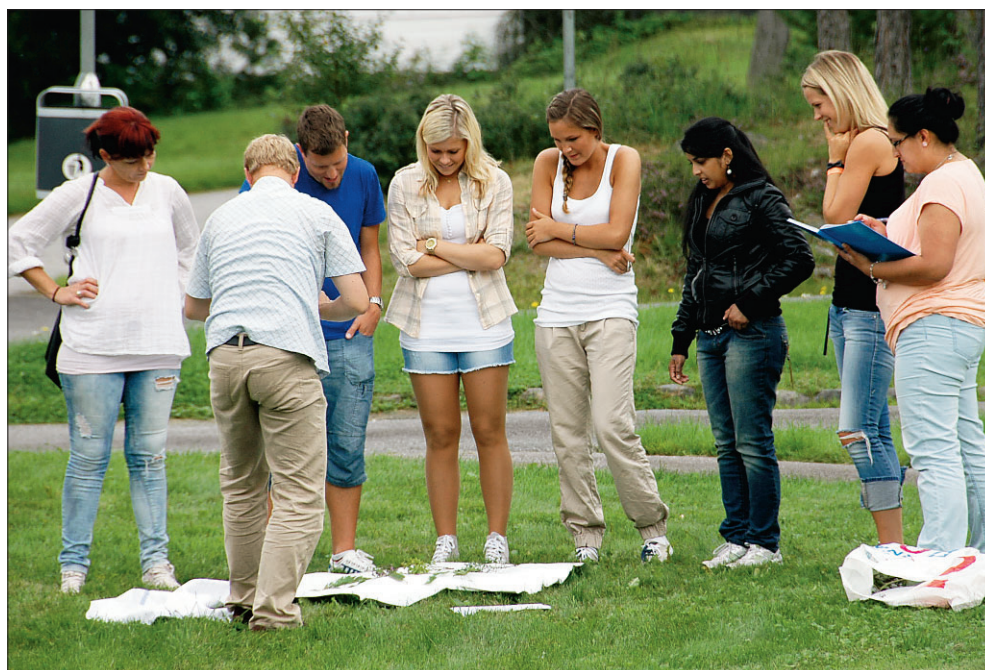
Frå oppstarten på Breistein i august.