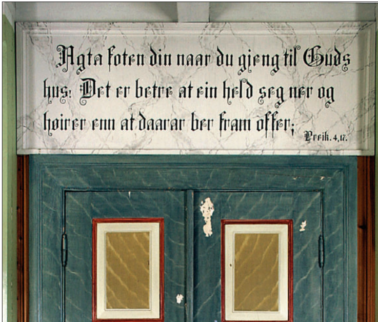
Frå Stamnes kyrkje, inngangen vest i skipet.

Vigslingsdagen for den tredje kyrkja på Stamnes var etter det me veit «ein fin haustsundag», 20. oktober 1861.