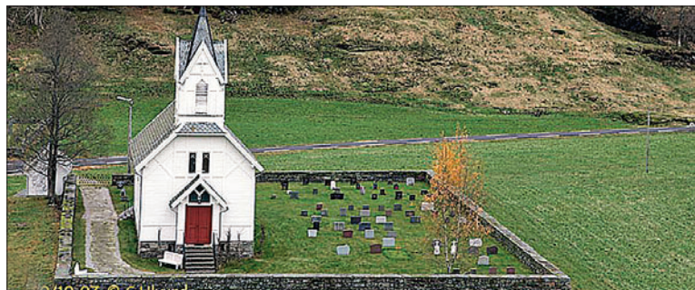
Nesheim kyrkje og gravlund.