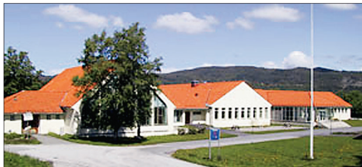
NLA på Breistein.

NLA Høgskolen, Bergen Breistein Sandviken