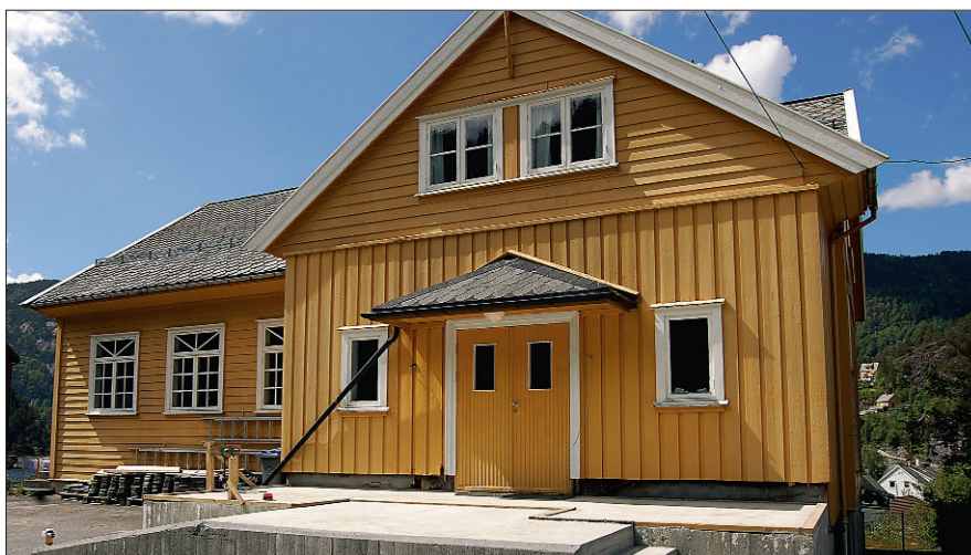
Bedehuset i juni, under bygginga av nytt inngangsparti med toalett.

I år er Stamnes bedehus 50 år, og dette vil verta markert med ei festleg samkome laurdag 25. september 2010 kl 17.00.