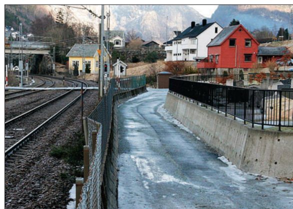
Her kjem den nye perrongen på Stanghelle stasjon.

og kyrkjevevja har vore i møte med Jernbanelinje. No er det gjort avtale om at det skal vere ei bufferson, eit plantefelt på ein meters breidd, mellom gjerdet til gravplassen og perrongen. Med dette tiltaket håper ein at ein får etablert ei skjerming mellom trafikantane og gravplassen som er tilfredsstillande i høve til dei som vitjar gravplassen. Tilkomst til den øvre delen av gravplassen er tilleten for vedlikehaldsoppdrag og båretransport. Arbeidet skal etter planen ta til etter sommaren.