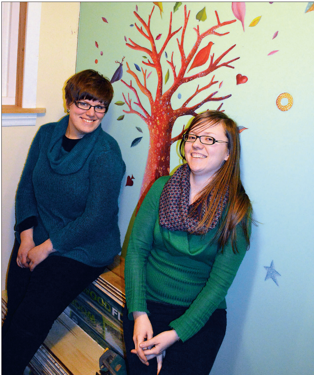
«Han er treet – me er greinene».