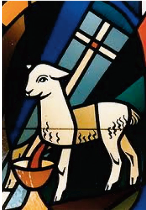
Biletet er lånt frå Wikipedia.

Jødane, veit godt kvifor dei feirar påske. Det har dei gjort i over 3000 år sidan Gud ved Moses leia folket frå slavekåra i Egypt. Farao ville halde på dei, men Gud viste sin makt då han sende 10 ulike plagar over egyptarane. Den siste var at alle fyrstefødde måtte dø. Men ingen barn hos jødane døyde, for dei ofra eit påskelam, og strauk blodet på dørstolpane i huset sitt. Då gjekk døden dei forbi.