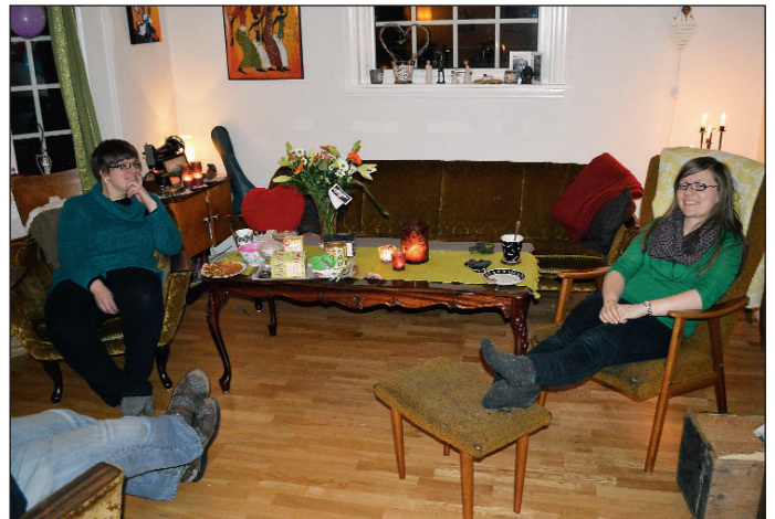
Tid til å slappe av heime i stova vert det òg.