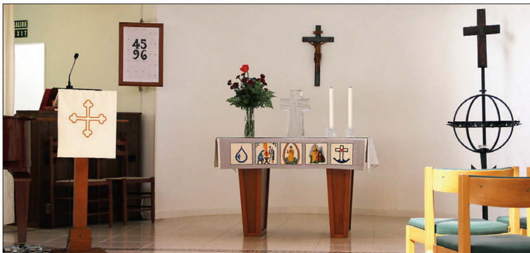
Frå Sjømannskyrkja på Tenerife.

Klokka var i tre-firetida på ein fredag midt i februar, og me hadde forsømt oss litt i høve til det norske vekeprogrammet som stod på oppslagstavla. Det var låste dørar. Litt snakk, og skuggar bakom matte vindauger, gav likevel håp om å få kontakt. Oppslaget utanfor kyrkjedøra hadde kontaktinformasjon. Eg prøvde å taste inn dei 13 sifra i telefonnummeret i rett rekkjefølgje, og fekk svar på spansk. Eg presenterte meg på norsk.