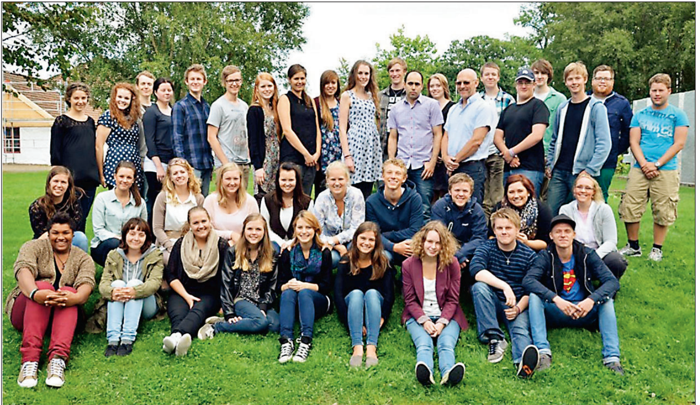
Acta Bibelskule, Lovsongskulen og Acta II.