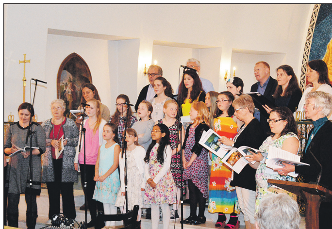
Kyrjekonsertar: Unge og gamle i samklang i Dale kyrkje under Daledagane.

I tillegg til eiga møteverksemd der vert husa utleigd til mellom anna minnesamvær, konfirmasjonar, åremålsdagar, konfirmantsamlingar og kursverksemd.