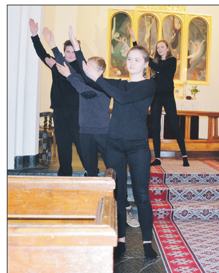
og å danse til Our Father – som er Herrens bøn i engelsk språkdrakt.

For konfirmantane i Dale, Stamnes og Vaksdal sokn var det felles Ung Messe («Samtalegudsteneste») i Vaksdal kyrkje like før sjølve konfirmasjonsgudstenesta. Konfirmantane i Eksingedalen hadde sin samtaledel integrert i konfirmasjonsgudstenesta, der dei tok del i lesing frå Bibelen og i sjølve preika. Konfirmantane frå Eidsland hadde si samtalegudsteneste i Modalen.