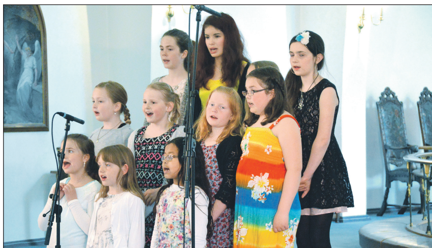
Korskulen i Vaksdal: Korskulen syng rundt om i kommunen, i kyrkjene og andre stader. Her frå konserten i Dale kyrkje under Daledagane i år..