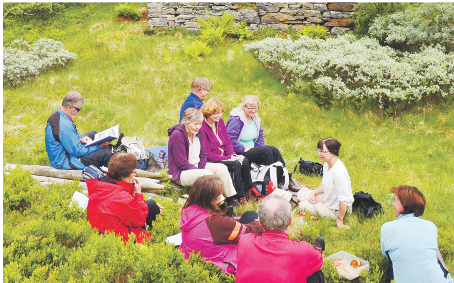
Gudsteneste: Frå Stølgudstenesta i 2013.

Bukkatødna er gamle murar etter ein støl som høyrer til garden Hatlestad. Turen er om lag 3,5 km, og har ikkje bratt men varierende stigning. Det er høve til å parkere ved det gamle skulehuset på Hatlestad, og så gå 2-300 meter langs vegen før ein kjem til Hatlestad. Frå Hatlestad går det veg opp til Hatlestadstølen, og sti vidare til Bukkatødna. Ein vanleg turgjen-gar vil bruke ein dryg time til Bukkatødna. Det vert felles avgang frå Hatlestad kl. 13.30. Etter gudstenesta vert det felles matøkt – ta med mat. Viss vêret vert for dårleg er me i lavvuen på Småbrekke. Ta kontakt med Frode Kvamsøe (90 19 65 14) viss du vil vite heilt sikkert kor hen stølgudstenesta vert.