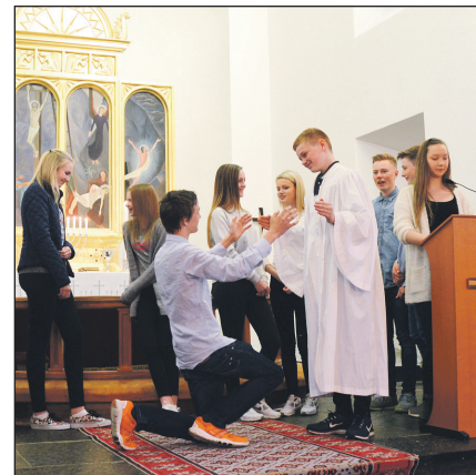
I Vaksdal kyrkje konfirmantane mellom anna med på å dramatisere ei bibelforteljing...

Det har vore konfirmasjon i fem av kyrkjene våre no i vår.