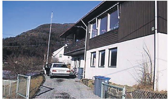
Vaksdal prestebustad frå då Edvard Bø flytta inn i 2001.

Frå og med 1. september 2015 vart buplikta avvikla, har regjeringa vedteke. Med det er ei ordning som har vore i 500 år sidan reformasjonen vorte historie.