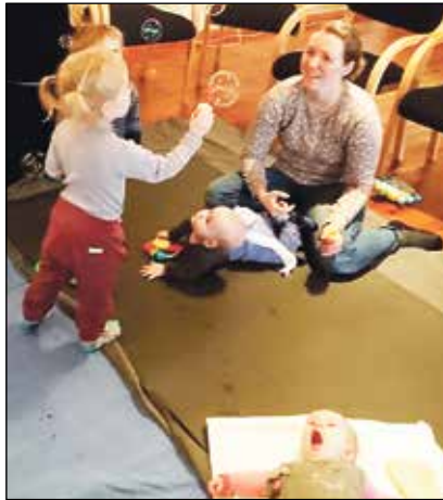
Kjekk gjeng som deltek på samlingar på Stamnes òg!