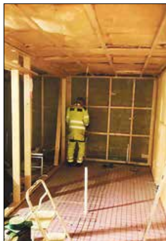
Nye og betre toalettforhold

gjer eit så stort rehabiliteringsarbeid, så dukkar det også opp ting undervegs som ein ser skulle vart gjort i same omgang. Dette gjeld nytt golvbelegg på kjøkkenet og ikkje minst nytt sikringsskap. Spesielt det siste vart ei større tilleggsinvestering, men samstundes er det mange gode grunner til å gjera dette i same omgang som sjølve rehabiliteringa av underetasjen.