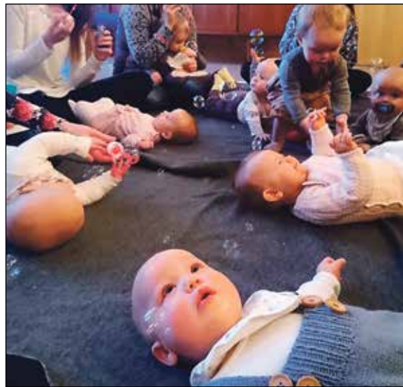
Om nokon sutrar litt på slutten av babysongen, forsvinn tårene kjapt når me hentar fram såpeoblene