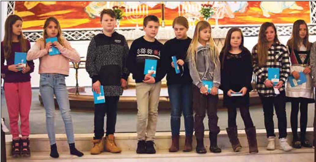
Elleveåringar frå Dale sokn fekk NT på Lys Vaken-gudstenesta.