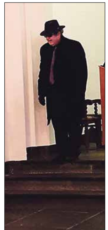
Mystisk agent kom med melding frå sjefen.