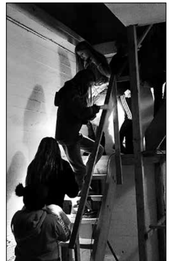
Bratte trapper opp til tårnet i Dalekyrkja.

I slutten av januar inntok fleire av årets elleveåringar Dale kyrkje, og overnatta der. Dei var nok spente då dei kom til kyrkja, for fyrste gong med sovepose! Men opplegget fenga, og det vart eit kjekt lite