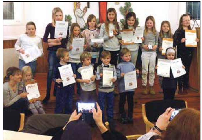
Ein fin gjeng fekk diplom for deltaking i barnekoret på Stamnes.

Folk i både Stamnes- og Eidslandsbygdene hadde vore skikkeleg rause med å gje gevinstar til basaren, og dette takkar Soknerådet hjarteleg for! Me takkar også styret for bedehuset, som hadde gitt