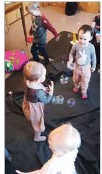
Det myldrar godt på småbornssongen