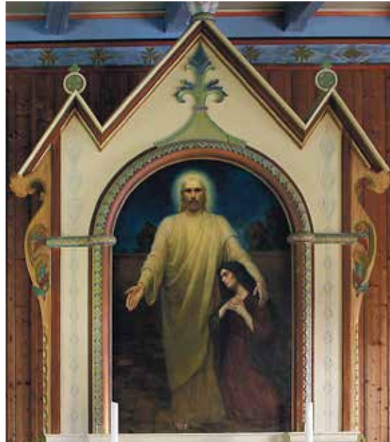
Altartavla i Stamnes kyrkje.