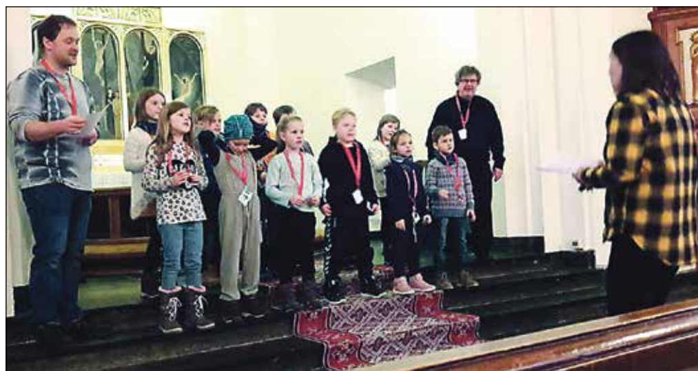
Agentane øver på tårnagentsongen.