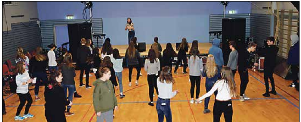
Konfirmanntane fekk og opplæring i korleis dei kunne føre seg - danse - på scena.

hadde ungdomar som coacha dei. Dei fleste av desse er elev-ar ved Kongshaug Musikk-gymnas, og hadde som opp-gåve å hjelpe konfirmanntane med å lage eit «sceneshow» og øve inn sjølv salma, samt hjelpe til under framføringa. Sokneråda var engasjerte med matsservering, vakthald og