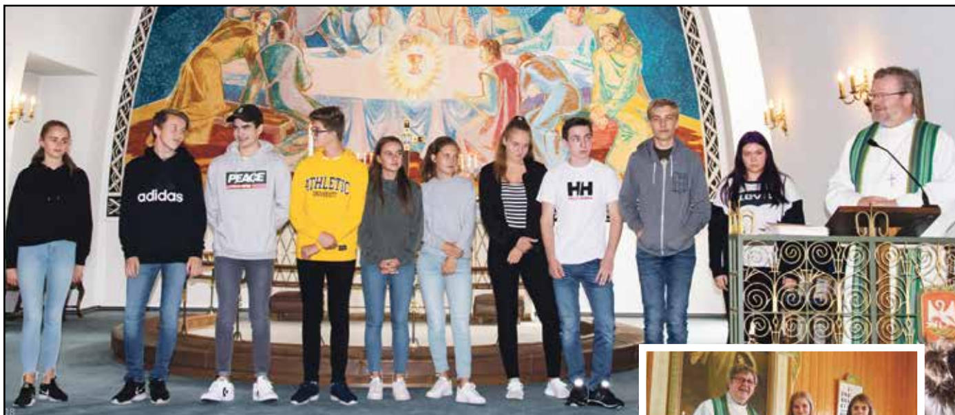
Her vert konfirmantane i Dale sokn presenterte...