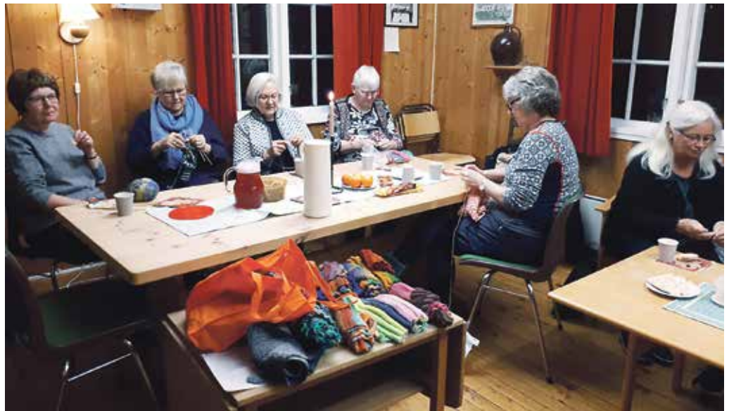
Spøtekafe: 12 spøtarar var samla til spøtekafe i Stamnes kyrkje ein onsdag i november. Her er nokre av dei.