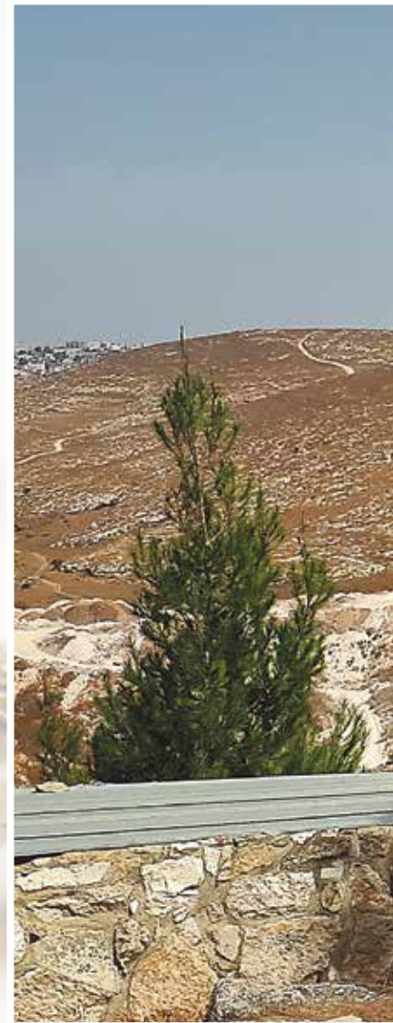
Utsikt over Betlehemsmarkene.

Me kjende oss trygge heile tida, sjølv om me såg rikeleg av væpna politi og soldatar dei fleste stader. Bussen vår kryssa grensene mellom såkalla israelsk og palestinsk side mange gonger utan problem anna enn for den israelske guiden vår. Ho kunne som israelsk statsborgar ikkje bli med inn i palestinsk A-område, som i praksis vil seia byar som Betlehem og Nablus.