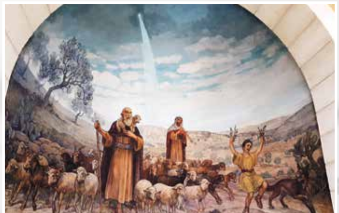
Frå kyrkja ved gjetarane sine grotter.

englesongen om frelsaren som var fødd og om fred over jorda! I kyrkja like ved, med vakre veggmaleri frå juleevangeliet, var det stemningsfullt og heilt naturleg å syngja «Fager er jorda». Det var mange blanke auge å sjå etterpå, ei fin oppleving og