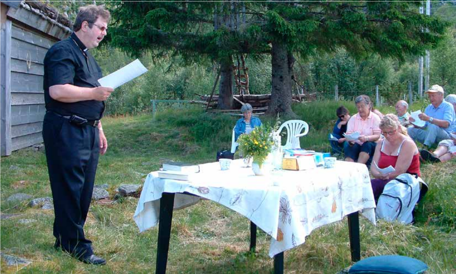
Skarvastølen: Frå stølgudstenesta på Skarvastølen, då ho var der i 2007.