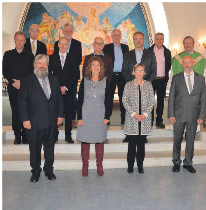
Konfirmerte i Dale kyrkje 19. april 1970: