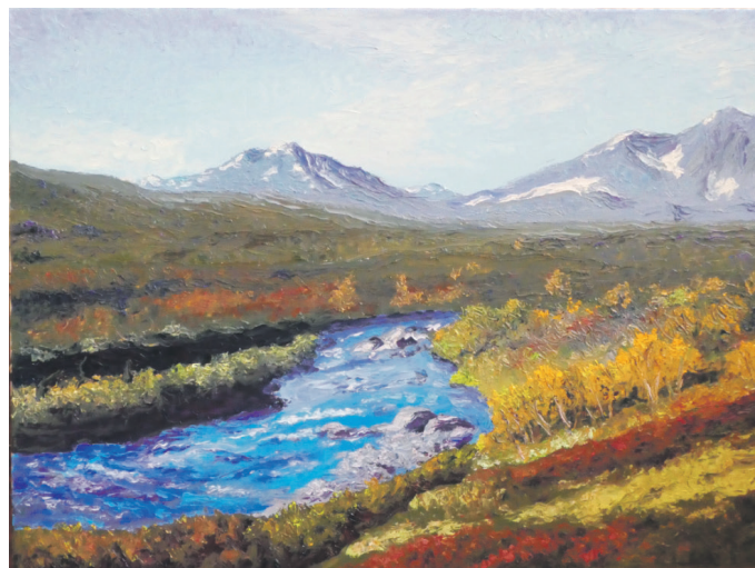
Måleri: Eit av måleria til Jarle