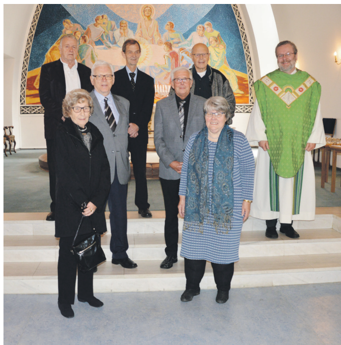
Konfirmerte i Dale kyrkje 25. september 1960:

I år var det berre på Dale det var konfirmantjubiläum. Sokneråda på Stamnes og Vaksdal valde å utsetje desse jubilea til neste år grunna den usikre korona-situasjonen. På Dale var 50- og 60-årsjubilantane samla til gudsteneste og fest i bedehuset søndag 18. oktober.