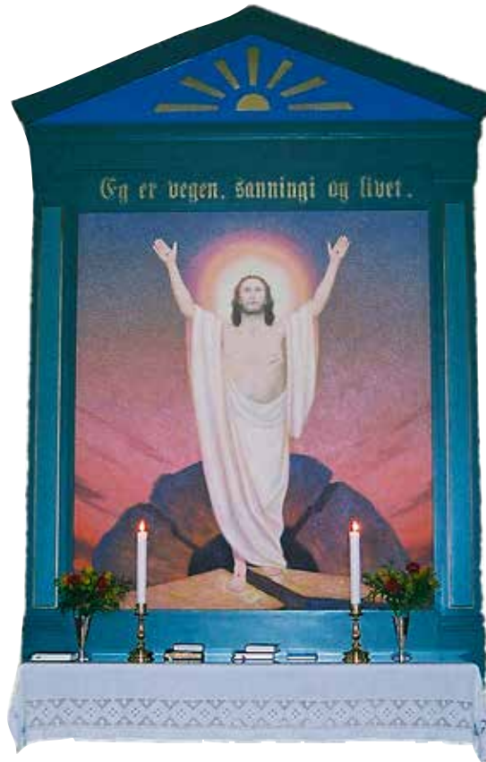
Altartavla i Nesheim kyrkje.

Tre ting gjer her evangeliet om den oppstadne truverdig. At dei næraste i krinsen rundt Jesus fekk sjå han levande, etter at dei hadde forvissa seg om at han var død på krossen og lagt i grava. Dei gjorde det i fellesskap. Her hos Paulus er einaste plassen at me får høyra at 500 fekk sjå han samstundes. Men Paulus oppmodar kyrkjelyden til at om dei tviler kan dei sjekke sjølve, for mesteparten av dei 500 levde då brevet vart skrivne. For i tillegg å styrkje truverdet, fortel Paulus at