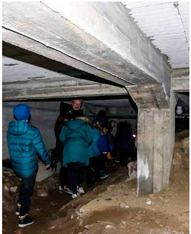
Spennande: Tårnagentar i tårnet.

Andre helga i februar inntok fleire av årets elleve- og tolvåringar Dale kyrkje, og overnatta der. Dei var nok spente då dei kom til kyrkja, for fyrste gong med sovepose! Men opplegget fenga, og det vart eit kjekt lite døger i kyrkja. Dei var gjennom ulike aktivitetar, blant anna laging av Kristuskrans (arm-