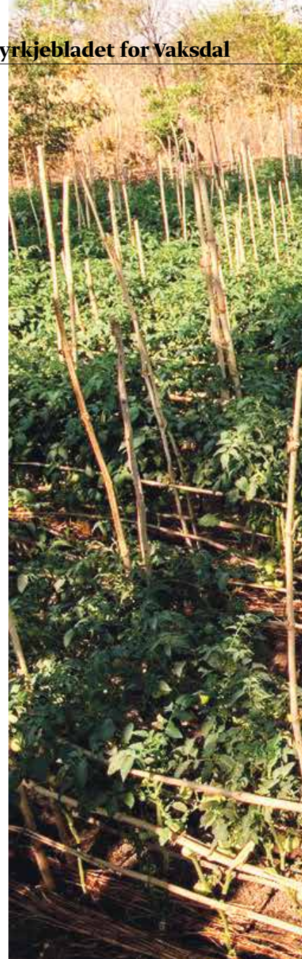
Nye metodar: Agronomen har ansvar for 17

- Bøndene og familiane deira har no enkel og føreseieleg tilgang til grønsaker. Dei har auka inntektene sine og dei investerer vidare. Før hadde dei kanskje ingen eller lite pengar. No har dei ei sta-