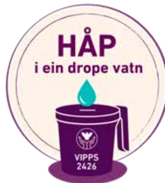
Fasteaksjonen til Kirkens Nødhjelp