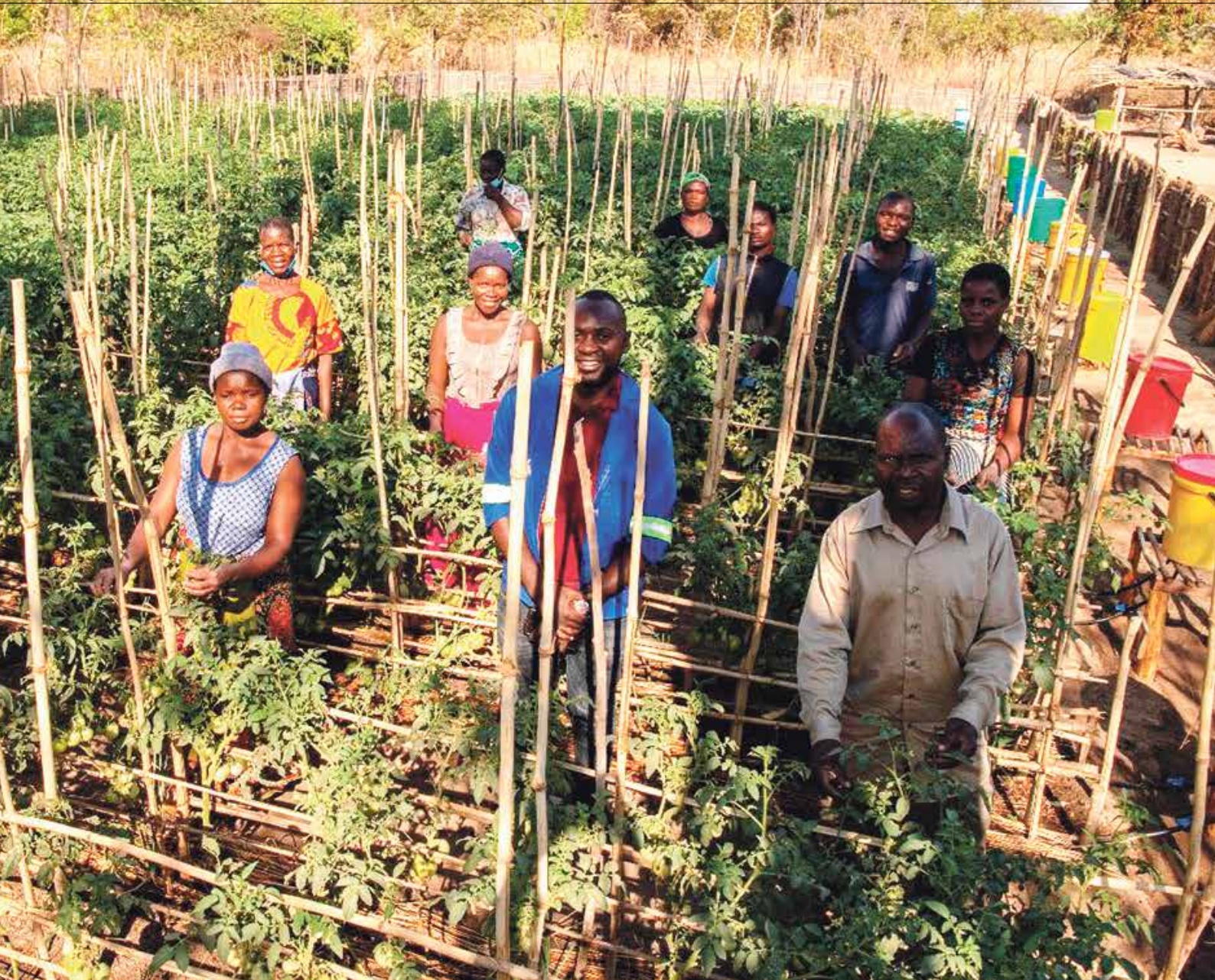
område med 12 bønder i kvart område. Han lærer dei om nye metodar og korleis ein får mest ut av grønsakåkeren sin.