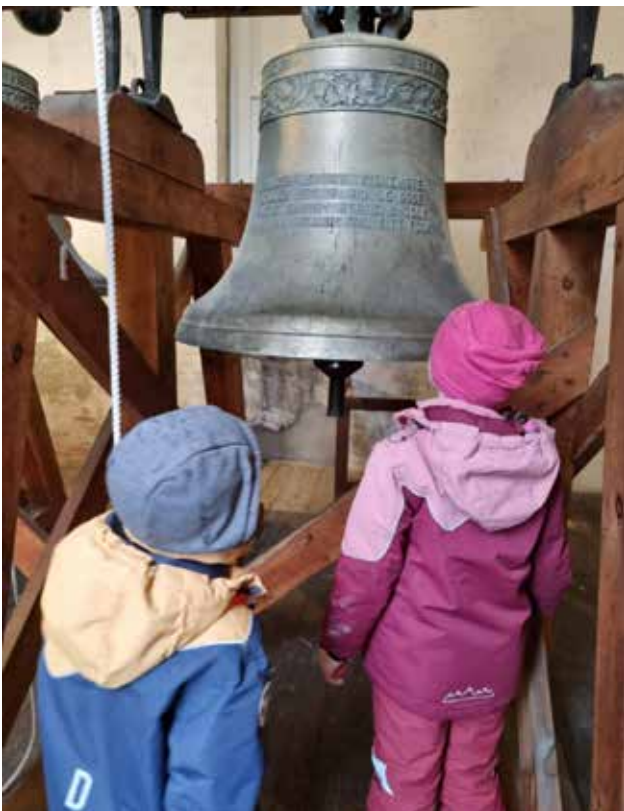
Spennande: Tårnagentar i tårnet.

Fyrste helga i februar kom fleire åtteåringar til Vaksdal kyrkje for å bli tårnagentar. Fyrst måtte alle seia eit passord, for å koma fram til der dei fekk agentkortet sitt - med eige fingeravtrykk sjølvsgagt! Med agentkort rundt halsen og ein eigen agentbevegelse på plass, fekk agentane ulike oppdrag dei skulle løysa, samstundes som dei var