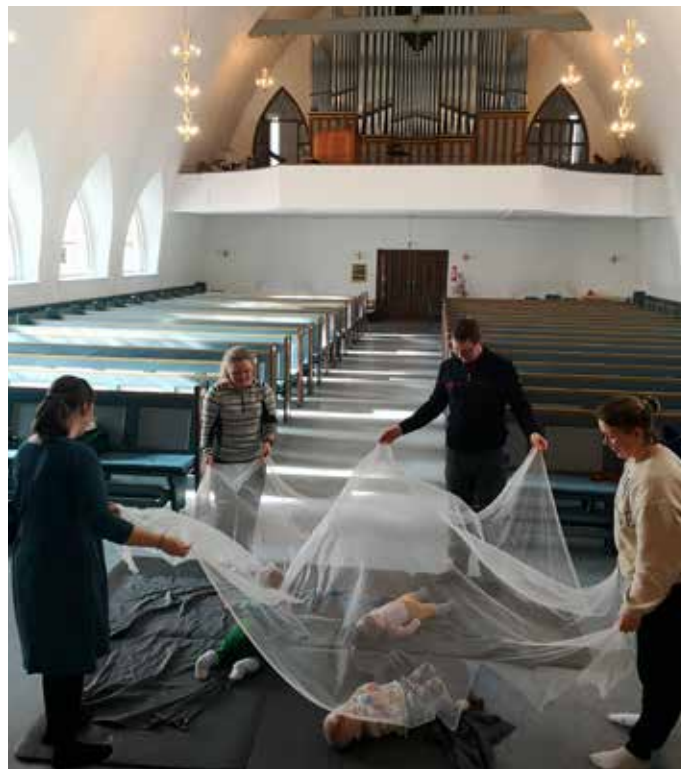
I kyrkja: Babyar i Dale kyrkje vert fascinert av havet som bølgar over dei.

I vår har me halde fram med samlingar parallelt i fleire bygder. Måndagar er det baby- og småbornssong på