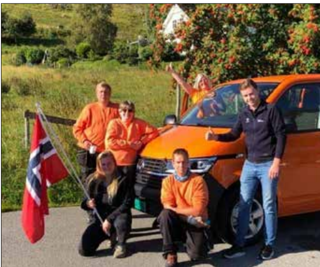
Gjengen feirar ny bil.