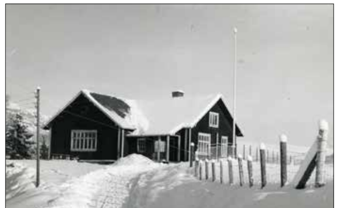
Torsheim forsamlingshus. Foto:Nils Neste, eier: Valdresmusea