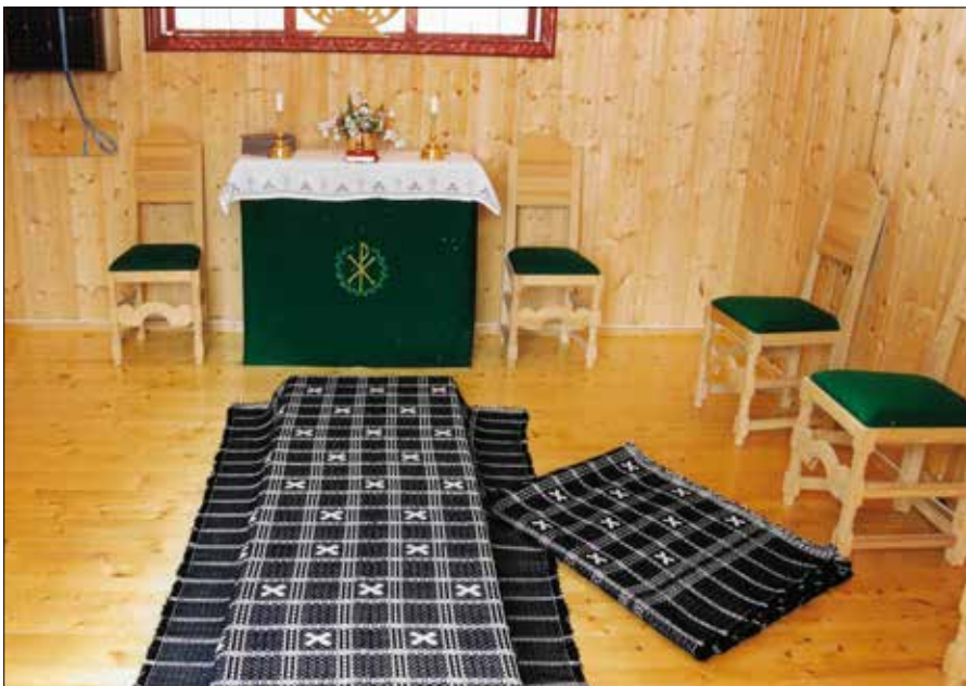
Bårerommet ved Høre stavkyrkje med dei to katafalkteppa