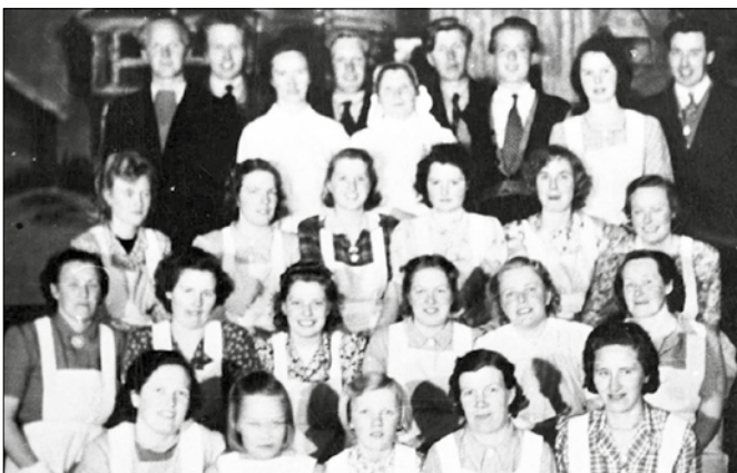
Førstehjelpskurs. 20