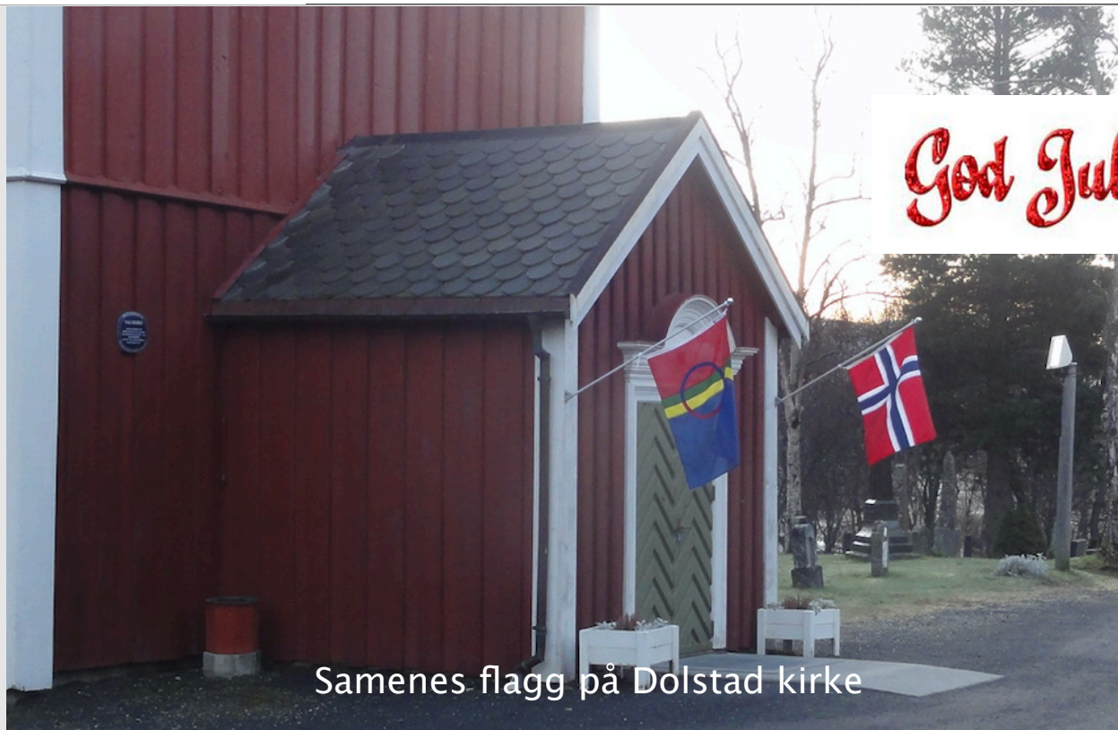
Samenes flagg på Dolstad kirke

Menighetsblad for Dolstad, Drevja og Elsfjord sokn.