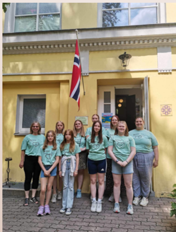
Drevja og Elsfjord barnekor foran sjømannskirken