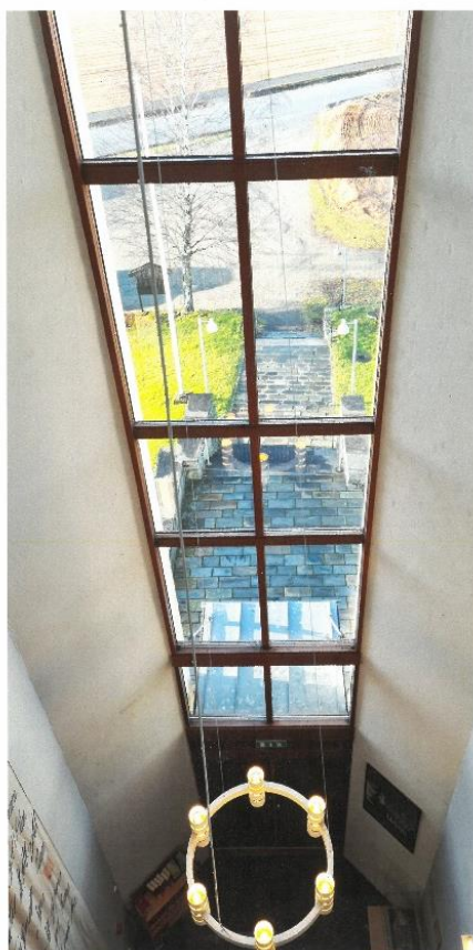
Den gamle kirken i Såner var bygget i 1880 og påtønt Kr. Himmelfartsdag 25. mai 1995. Den nye kirken ble innviet den 1. søndag i advent i år 2000.