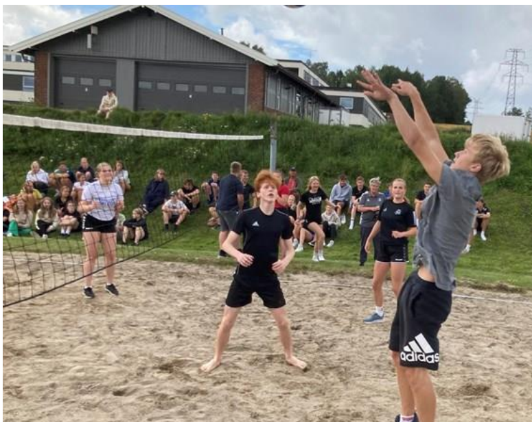
KONFIRMANTLEIR PÅ HAUGETUN

Vi har en lang tradisjon med konfirmantleir på Haugetun folkehøyskole.