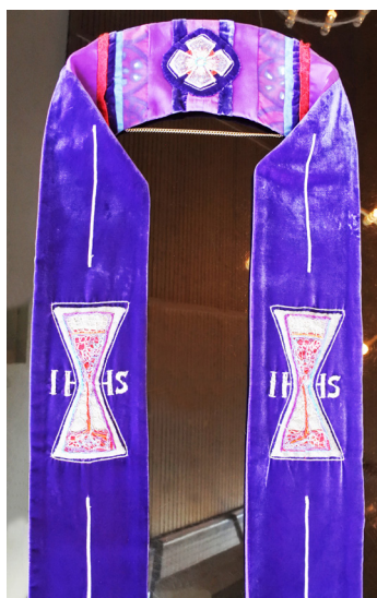
Lilla messehagl detalj, til venstre.