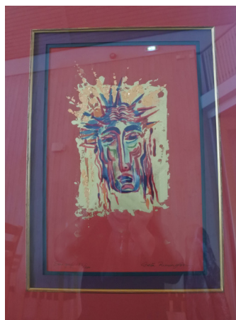
Maleri av Rimington som henger i Såner Kirke

Detalj av grønn messehagl øverst til venstre.