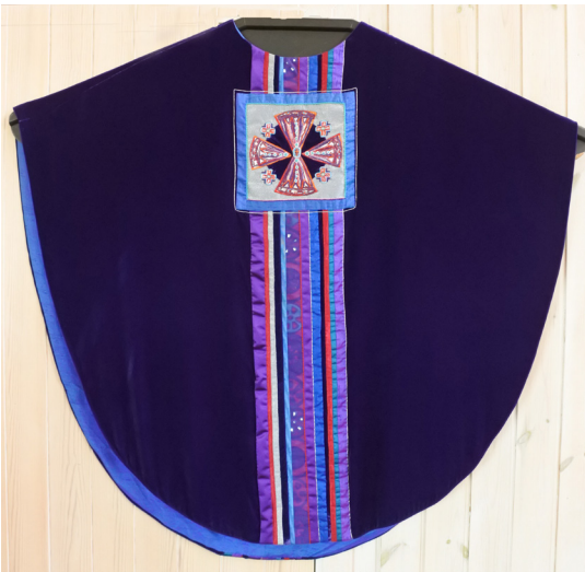
Lilla messehagl til venstre.

Videre her, ser vi bilder av en rekke av hennes arbeider - messehagler, stolaer og prekestolkleder, som hører til Såner kirke.