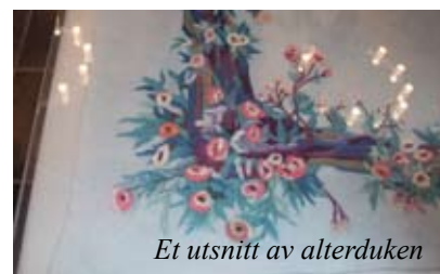
Et utsnitt av alterduken