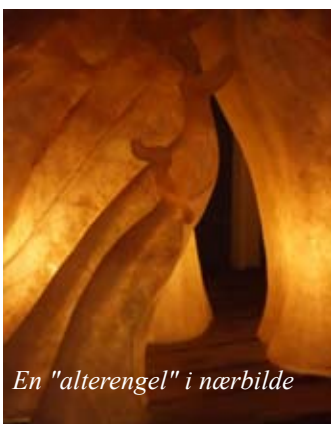
En "alterengel" i nærbilde