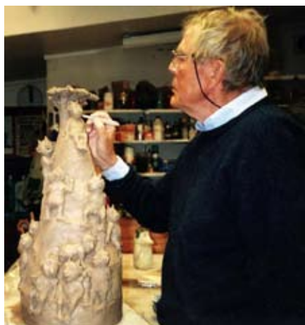
Finn i gang med å befolke sitt univers med nye skapninger.