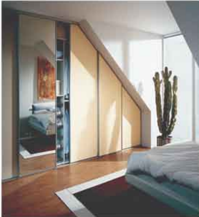
NB! Gratis oppmåling og konsulenthjelp.