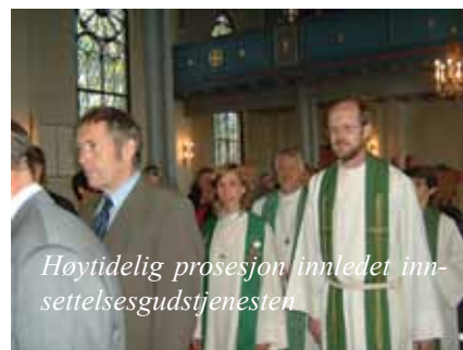
Høytidelig prosesjon innledet innsettelsesgudstjenesten