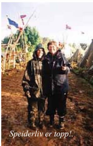
Speiderliv er topp!

Jeg begynte ved Luftforsvarets befalsskole i Kristiansand høsten 2002 med offiserskurs. Innledningsvis måtte jeg som alle andre gjennom 4 uker, hvor de "alminnelige" militære ferdigheter ble innskjerpet, som: å re senger, vask + omvask; marsjering og diverse øvelser osv. Gjennom