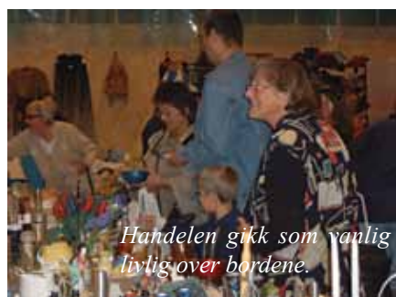
Handelen gikk som vanlig lyilig over bordene.

På søndag ble igjen lagerhallen omskapt til kirke for en gudstjeneste full av opplevelser..