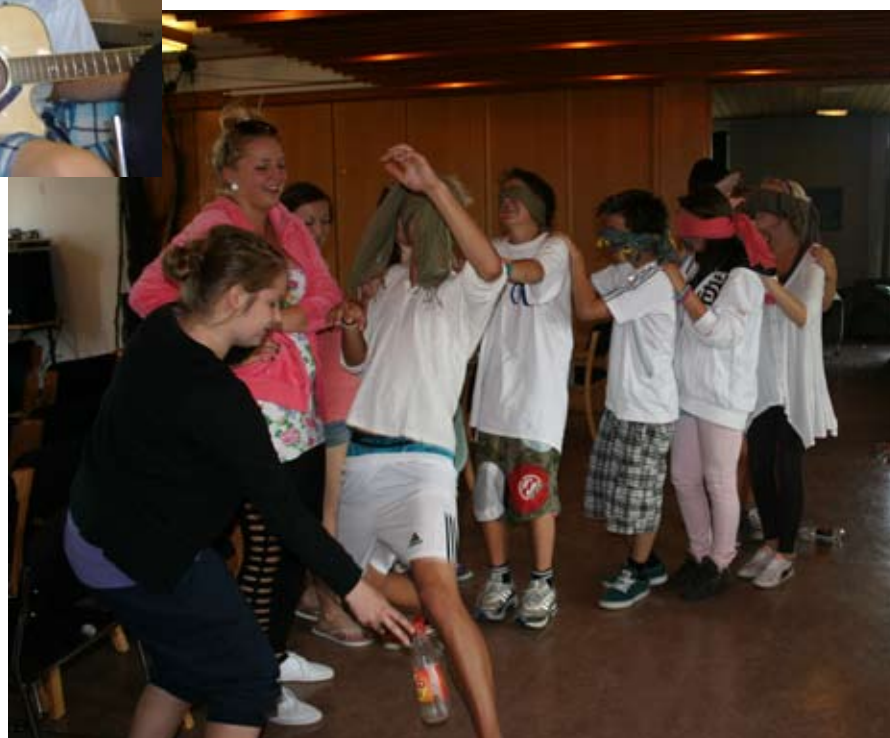
Som vi ser på forsiden, var pyramidebygging olympisk øvelse på konfirmantleiren. Og blindebukk var en annen!