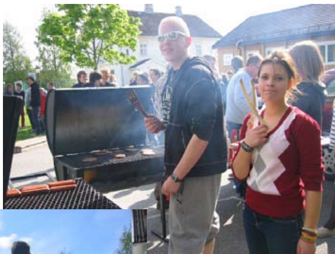
Alle konfirmantene var samlet til aktivitetsdag i Garder i mai