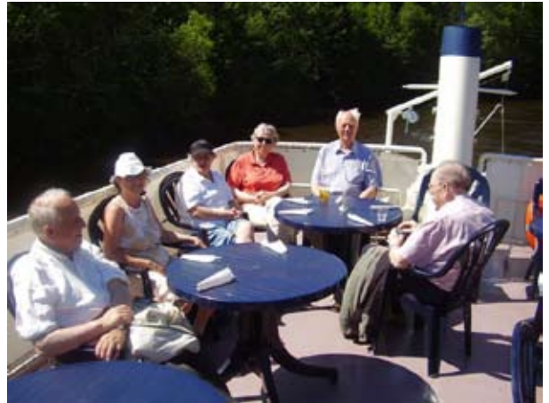
Stemmingsbilde fra en av formiddagstreffets sommerturer.

sorg for syke og fattige, hospitalene, barnehjemmene for de foreldreløse, fattighusene, sykepleieutdanningen, rusinstitusjonene. Menighetsstretene og diakonissene slet helsa av seg i de fattige gråbeingårdene på Vaterland og Tøyen.