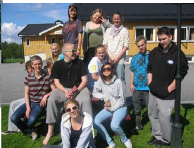
En litt trøtt gjeng etter overnatting med Minilederkurset på Gardarheim