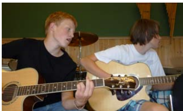
Gitarkamerater i bandet på konfirmantleir