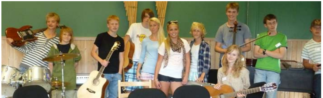
Musikkgruppa på konfirmantleir