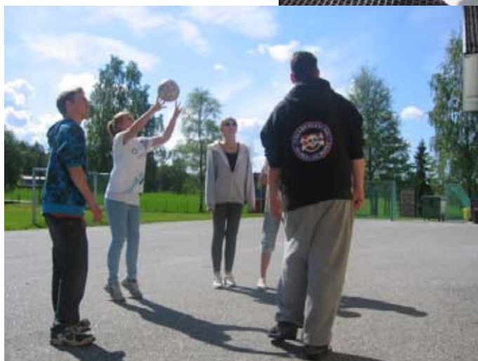
Deltakere på Minilederkurs på Gardarheim i mai