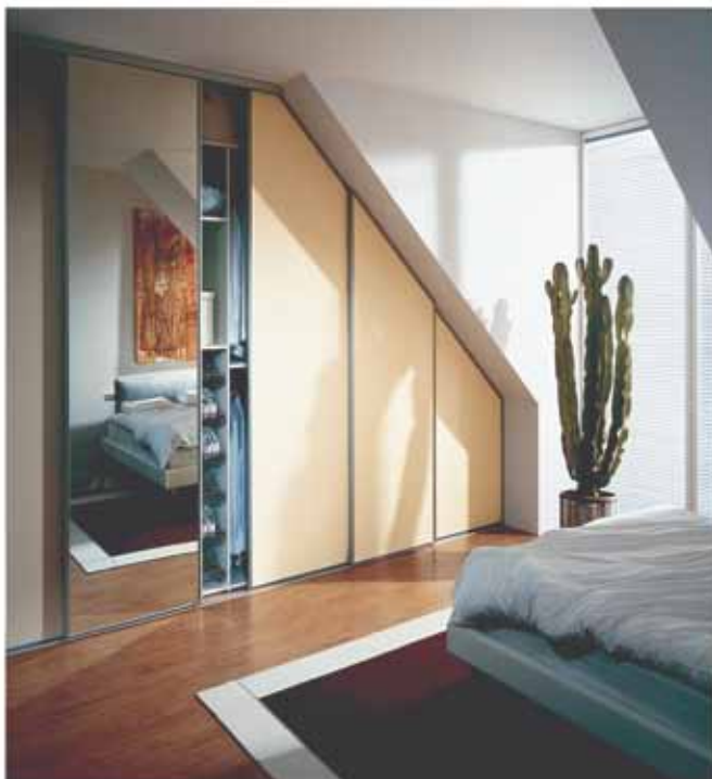
NB! Gratis oppmåling og konsulenthjelp.