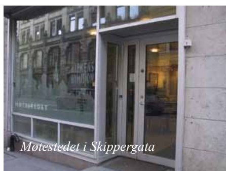
Møtestedet i Skippergata

skelig. Bakmennene har et sterkt grep om jentene – og om familiene deres hjemme. De har gått inn i prostitusjon på grunn av fattigdom. Mange av jentene er helt ukjent med norsk språk, samfunn og kultur og blir avhengige