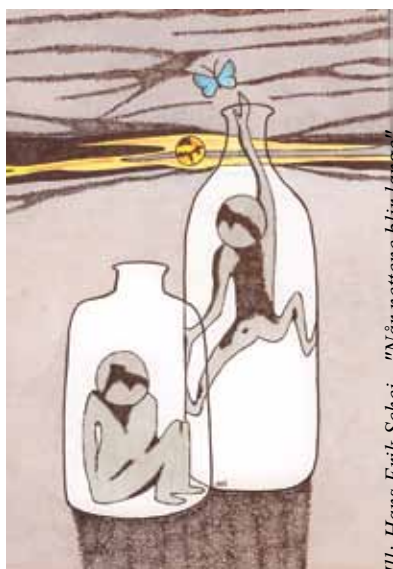
Ill.: Hans Erik Schei - "Når nettene blir lange"

Du kan gå inn på www.bymisjon.no på internett eller ringe 22365500 og be om å få tilsendt bladet Bymisjon. I boka "Når nettene blir lange" (Genesis forlag, redaktør H.E. Schei) kan du lese mer om jentene som kommer til Nadheim.