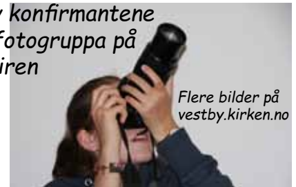
Flere bilder på vestby.kirken.no

Ellers har de sosialt samv, undervisning, bading og g å bli kjent r mennesker Son, Vestby og Garder.