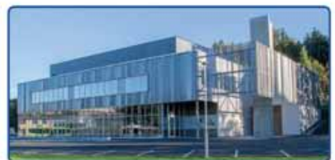
Smia Flerbrukshus - Frogn

Vi utfører nybygg og rehabilitering innen privat og offentlig sektor