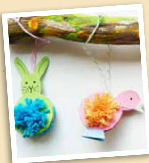
Med litt papp og garn lager du søte kaniner og kyllinger til påske. Plukk noen kvister og heng de på.

Her er noe av det vi har laget på Sprell som er enkelt og hyggelig å lage nå når det nærmer seg påske.