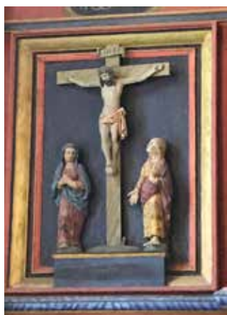
Øystese kyrkje i Hardanger