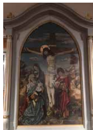
Oppdalen kapell, Lunner