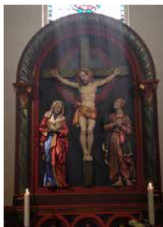
Raufoss kirke, Vestre Toten