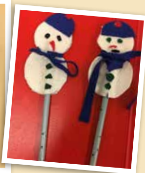
Filt- og pappsnømann pynter opp en helt vanlig blyant.