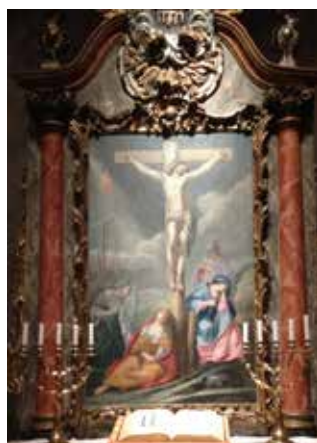
Brimnes kirke i Østfold