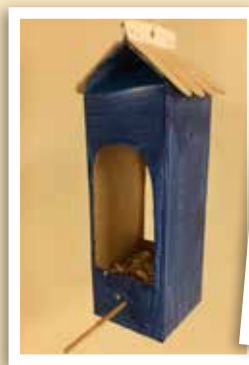
Lag fine fuglematere av melkekartonger.