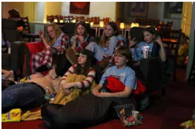
Gjengen koste seg stort under filmen "Stjernen" som presenterer juleevangeliet fra perspektivet til dyrene i stallen. Filmen anbefales for store og små. På engelsk heter den "The Star".

Men det var ikke bare læring som stod på agendaen. Etter en hyggelig pølsemiddag fulgte en spennende filmkveld, hvor barna kunne fordype seg i historien om "Stjernen" og la seg inspirere av dens budskap. Ungdomslederne våre rigga til sofaer og puter, og pynta skikkelig fint med lys og god stemning, og med litt godteri ble filmopplevelsen komplett.