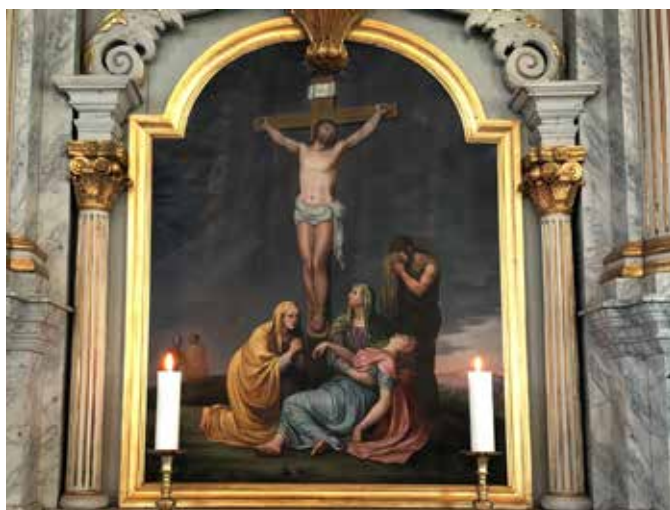
Altertavla er fra Sør-Fron kirke i Gudbrandsdalen malt av Fredrik Petersen i 1797. Den viser korsfestelsen på Golgata (Joh 19,25).

Kan det finnes en god Gud, når det er så mye ondskap i verden? Det spørsmålet står fortsatt uløst, men det står ikke