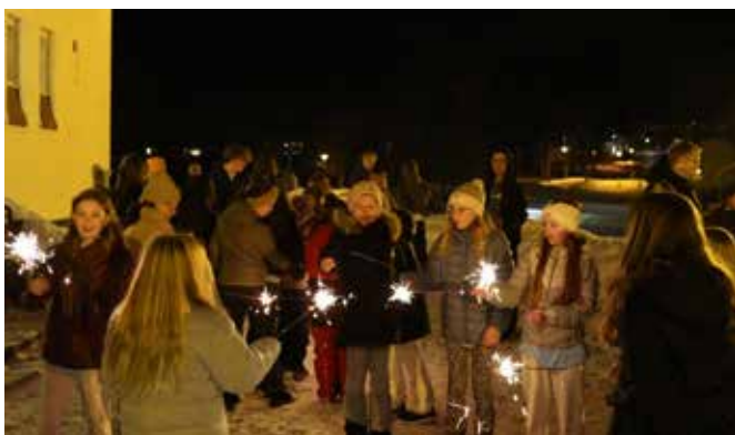
Ettersom Lys Våken vanligvis gjennomføres i slutten av november er det en gyllen mulighet til å ha en skikkelig nyttårsfest for kirkeåret - som begynner med adventstiden. Selv om årets Lys Våken ble litt senere enn planlagt er det alltid stas med stjerneskudd.

Facebook; Kirken i Vestre Toten , eller kirken.no/vestretoten