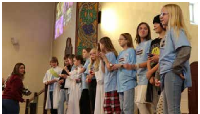
Noen av barna deltok også under preken. De holdt frem perlene fra kristuskransen og fikk si litt om det de hadde lært om symbolikk og betydning for de ulike perlene.