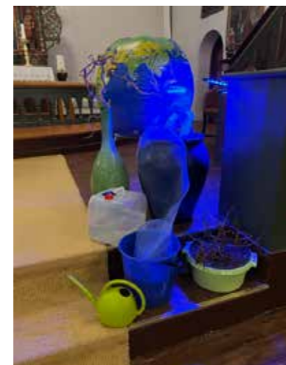
Fra gudstjenesten på askeonsdag.