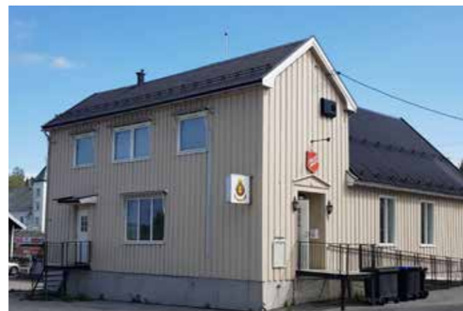
Frelsesarmeens lokaler på Raufoss ligger i Storgata 58.

Et annet tilbud annenhver torsdag (også partallsuke) er Sammen Familie kl. 1530 - 1730. Her samles mennesker på tvers av generasjoner til et varmt måltid, lek, aktiviteter og en kort andakt. Alt er tilpasset ulike aldersgrupper. Det er ingen krav om at man har familie for å komme. Tanken er å være et åpent hus for alle. Det skjer selvfølgelig noe de andre ukene også (oddetallsuke). Annenhver onsdag når det ikke er Strikkekafe, er det Kveldstreff kl. 1800. Dette er også som et åpent hus, hvor programmet varierer. Noen kveldstreff er som en temakveld eller kurskveld med foredrag. Andre treff er mer som en sosial møteplass med mye sang og musikk, god tid