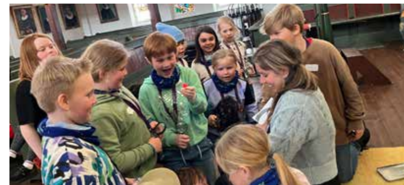
Tårnagenter i Ås kirke.

I april har vi arrangert Tårnagent for 3. klassingene i Ås og Raufoss menigheter. Det var godt oppmøte begge steder med godt over 20 Tårnagenter begge stedene. Barna kom til kirken etter ordinær gudstjenestetid og vi spiste Tårnagentpølser og koste oss med Agenttrening og lek en drøy halvtime. I Ås kirke var vi også så heldige å få besøk av politiet som viste oss spennende agent-triks og viste oss hvordan man kan samle spor og fingeravtrykk. Etter en tur i tårnet, litt undersøkelser av kirkegården og en kort sangstund fant vi ut at Kirkeskattesnusken hadde lurte unna kirkesølvet, og vi satte i gang med å løse det store mysteriet. Heldigvis var de flinke Tårnagentene effektive og grundige og sølvet kom til rette igjen så vi fikk feire nattverd da familie og venner kom til Tårnagentgudstjenesten på kvelden. På årets Tårnagent-samlinger deltok flere voksne ansatte og frivillige, og en god gjeng med ungdomsledere bidro godt til å skape en flott samling for barna.