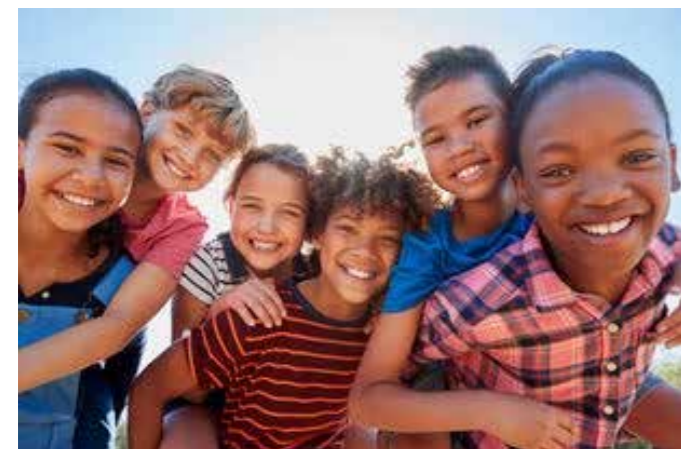
Barne-, ungdoms- og familiearbeid

En viktig møteplass er Matutdelingen annenhver mandag kl. 1500 - 1630 (partallsuker). Her får man muligheten til et varmt måltid, en kopp kaffe og en hyggelig prat, før man får med seg matvarer hjem. Måltidet og praten er åpent for alle. Matvarene er for de som trenger det av økonomiske grunner. Det som kalles nødhjelp. Det varierer mellom 50 og 100 personer som benytter seg av dette tilbudet, og flere av disse kommer på vegne av familien. Nedslaget teller derfor flere hundre personer månedlig.