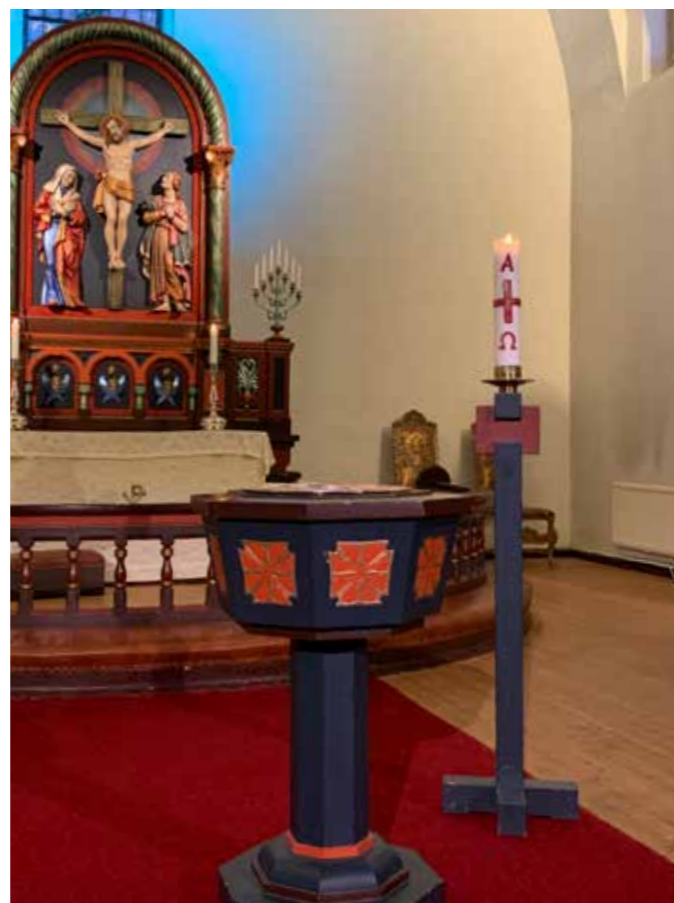
Lørdag 3.juni står døpefonten klar.

Ta gjerne kontakt med sokneprest Arild Kjeilen mobil: 996 47 857 e-post: ak952@kirken.no