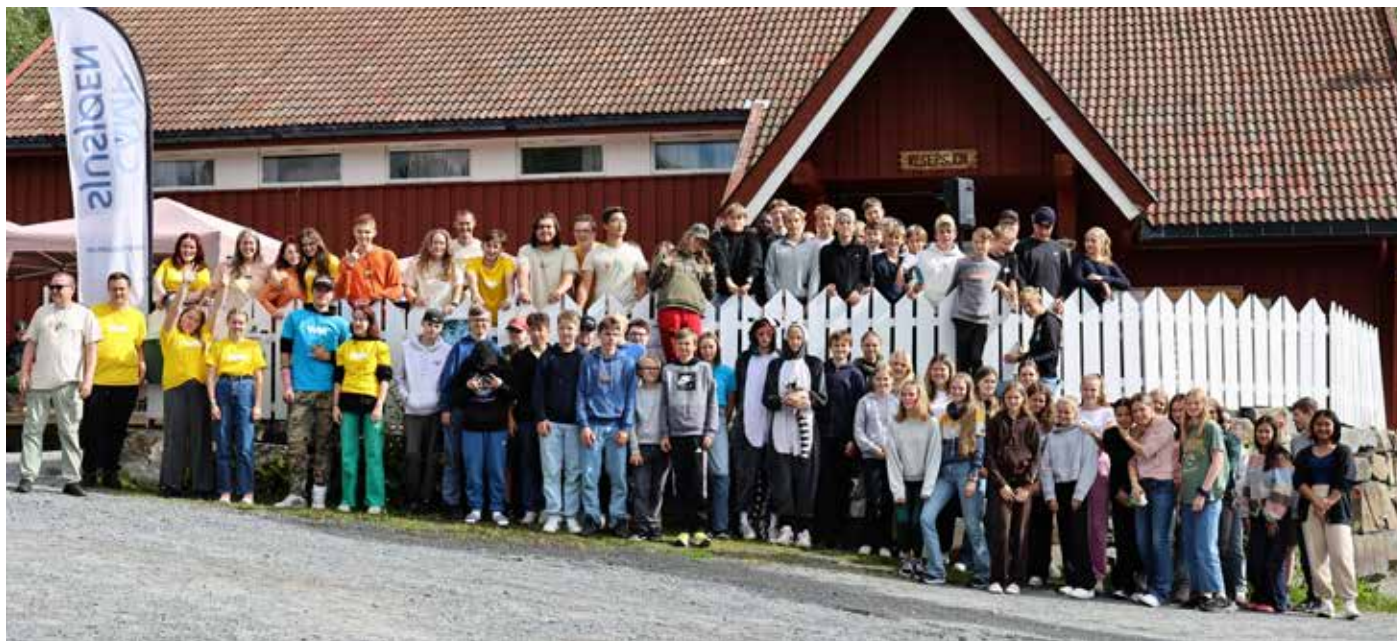
Det store leirfelleskapet.

tekst Åsmund Dannemark og Linda Gudbrandsen