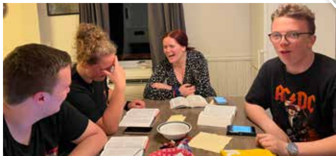
followme-leiderne forbereder gruppesamlingene.